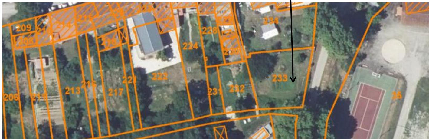
Parcelle C 233

M le Maire propose qu'en échange la municipalité s'engage :