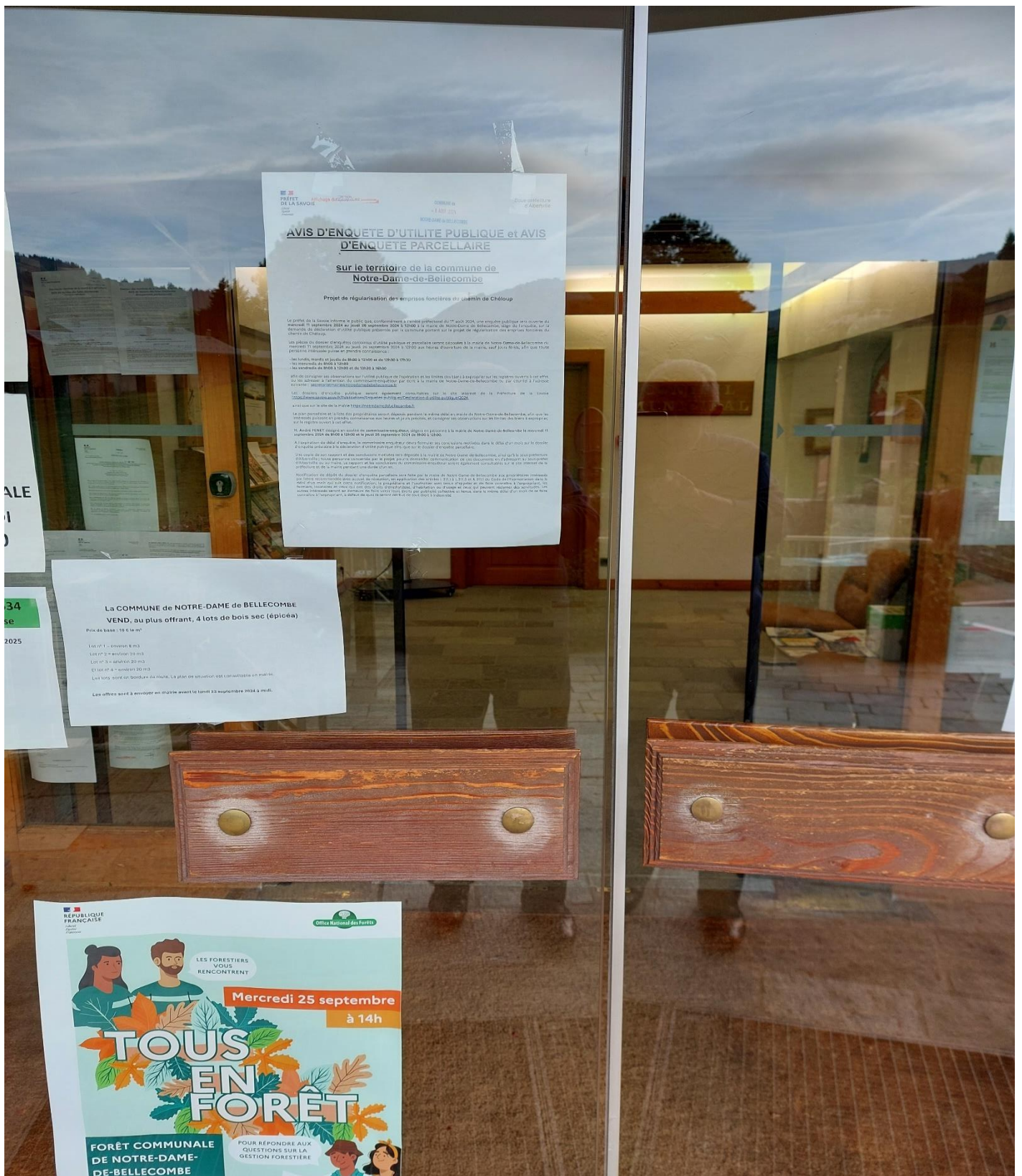
Enquêtes Publiques conjointes du 11 septembre au 26 septembre 2024 Enquête Publique préalable à la Déclaration d'Utilité Publique conjointement à une enquête parcellaire pour le projet de régularisation des emprises foncières du chemin du Chélop sur la commune de Notre-Dame de Bellecombe (Savoie)