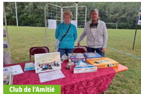
Club de l'Amitié