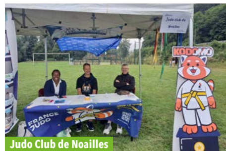
Judo Club de Noailles