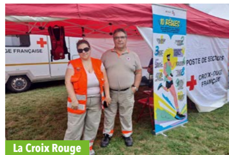
La Croix Rouge