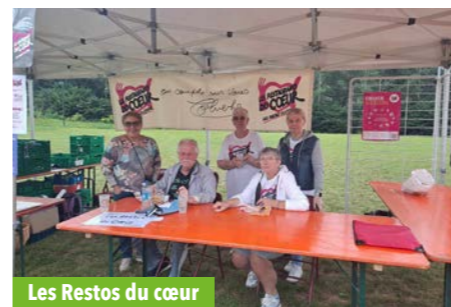
Les Restos du cœur