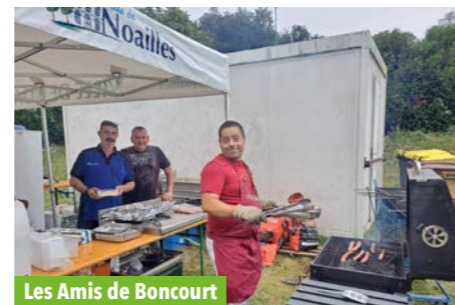
Les Amis de Boncourt