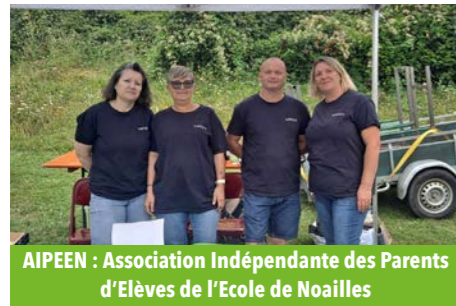
AIPEEN : Association Indépendante des Parents d'Élèves de l'Ecole de Noailles