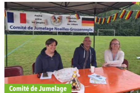
Comité de Jumelage