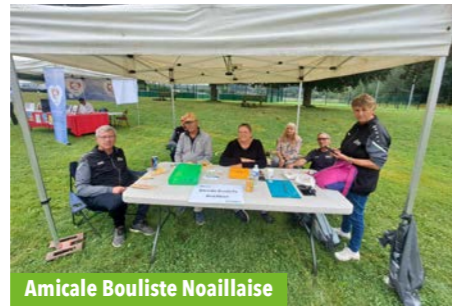
Amicale Bouliste Noillaise