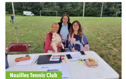
Noailles Tennis Club