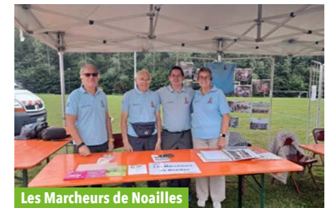
Les Marcheurs de Noailles