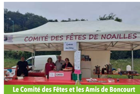
Le Comité des Fêtes et les Amis de Boncourt