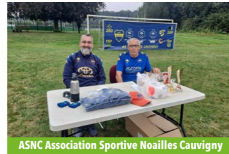
ASNC Association Sportive Noailles Cavigny