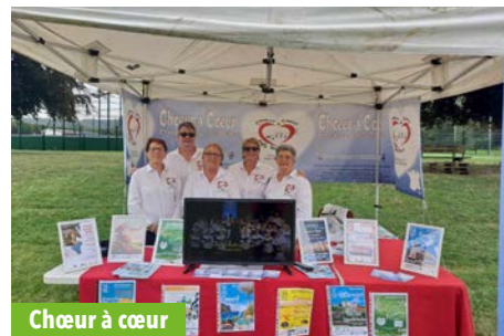
Chœur à cœur