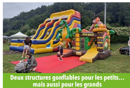
Deux structures gonflables pour les petits... mais aussi pour les grands