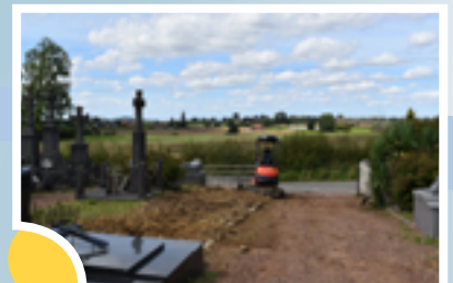
3 - Fin des travaux