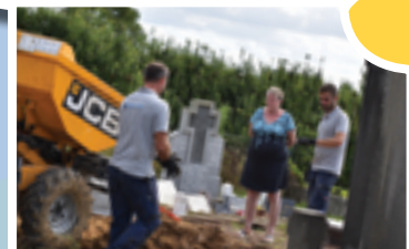
1 - Réunion avant travaux

Les restes des corps exhumés reposent désormais dans l'ossuaire situé au fond de la partie du cimetière où se trouvaient leurs tombes.