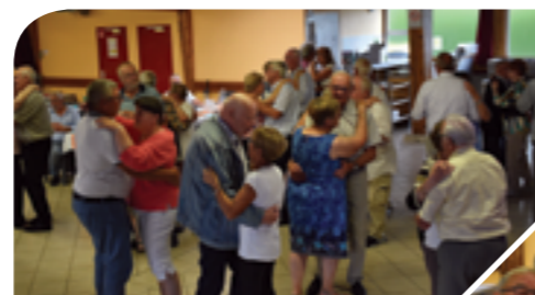
A la salle des fêtes 105 invités