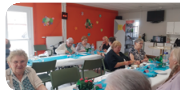
A la résidence Lindeboom 23 invités

Merci aux bénévoles qui ont assisté l'équipe municipale dans la préparation de la salle et lors du service. Leur bonne humeur a largement contribué à l'ambiance conviviale de cette journée.