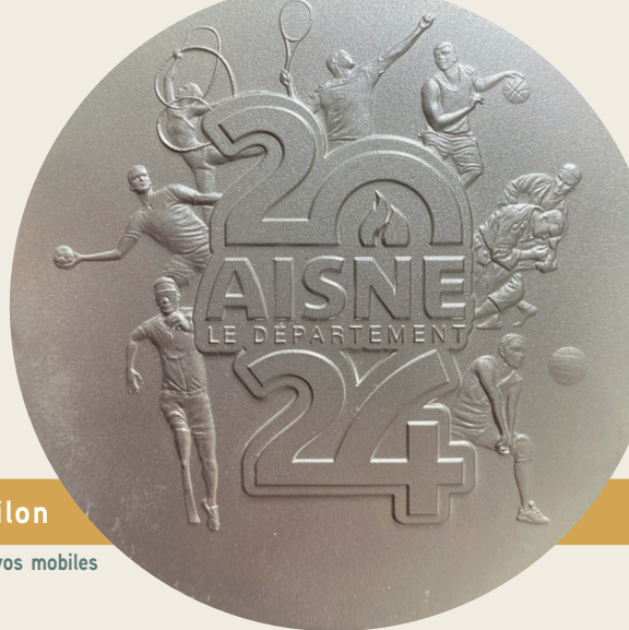
Céline Le Frère Maire de La Ferté-Milon

En complément de l'accueil par les assistantes maternelles, c'est un équipement très important pour les familles pour lesquelles la garde des enfants est toujours une préoccupation majeure.