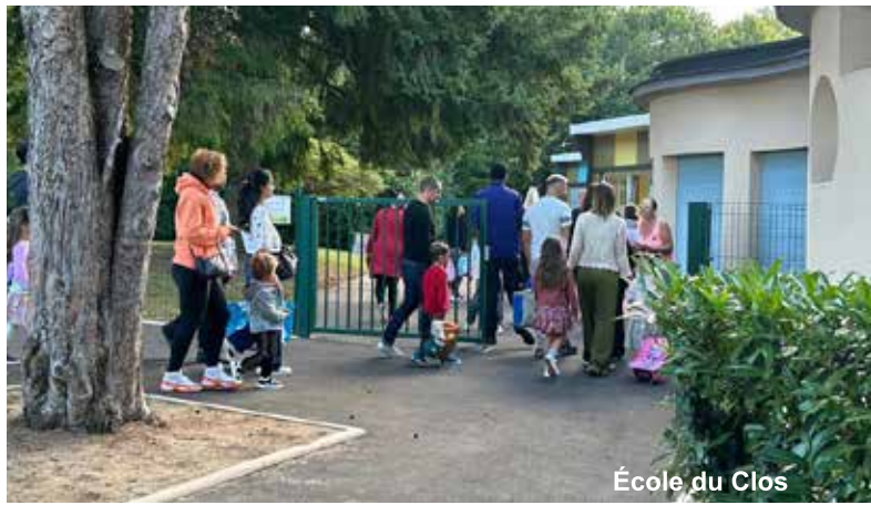
École du Clos