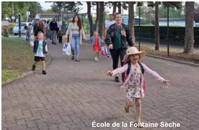
École de la Fontaine Sèche