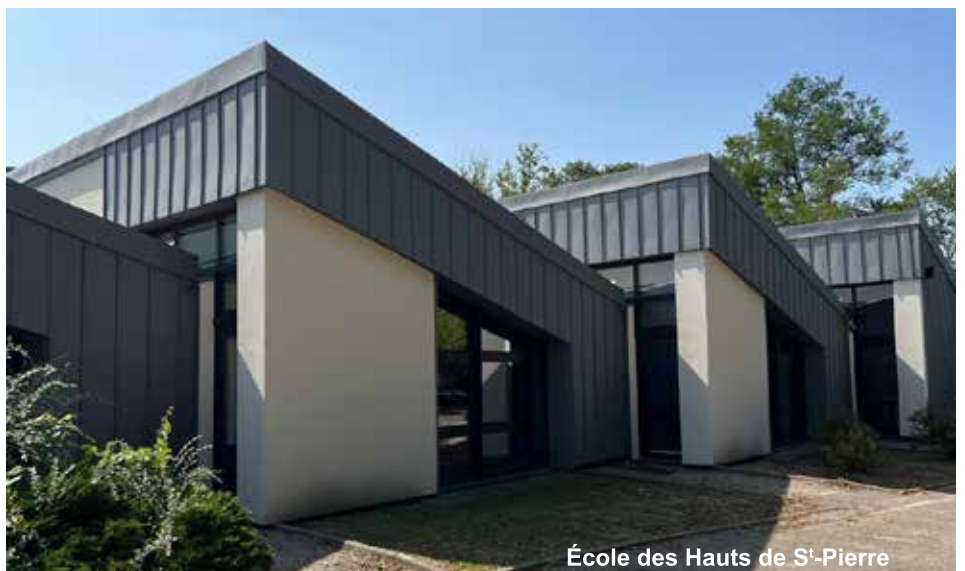
École des Hauts de S'-Pierre

Des travaux importants pour la ville portant les investissements réalisés depuis 2020 dans ce seul établissement scolaire à plus de 700 000 € et à 1 079 000 € sur l'ensemble des écoles.