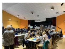
Bienvenue les nouveaux et remise des diplômes du concours maisons et balcons fleuris