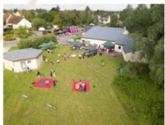
La fête du village