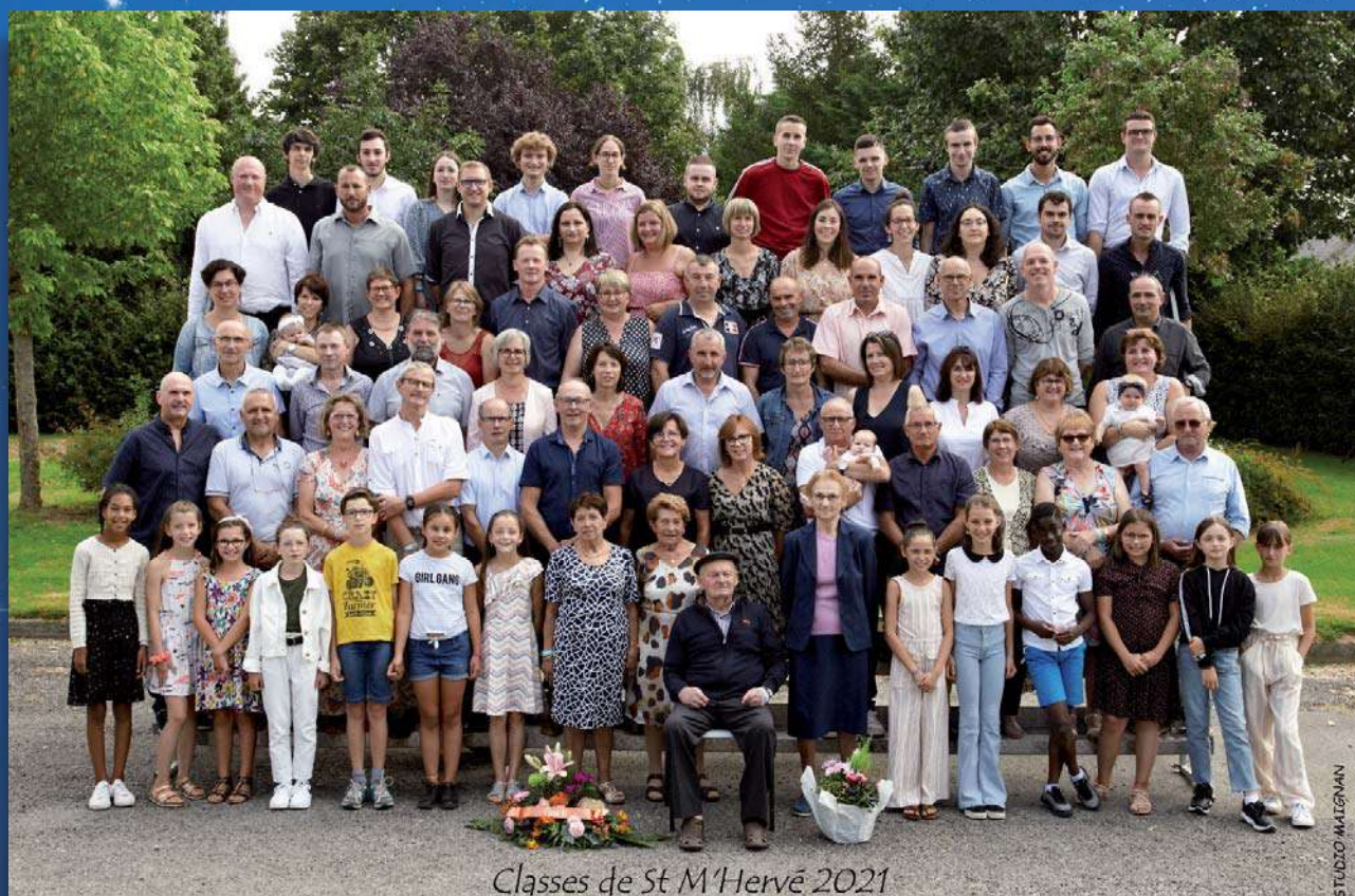
Classes de St M'Hervé 2021