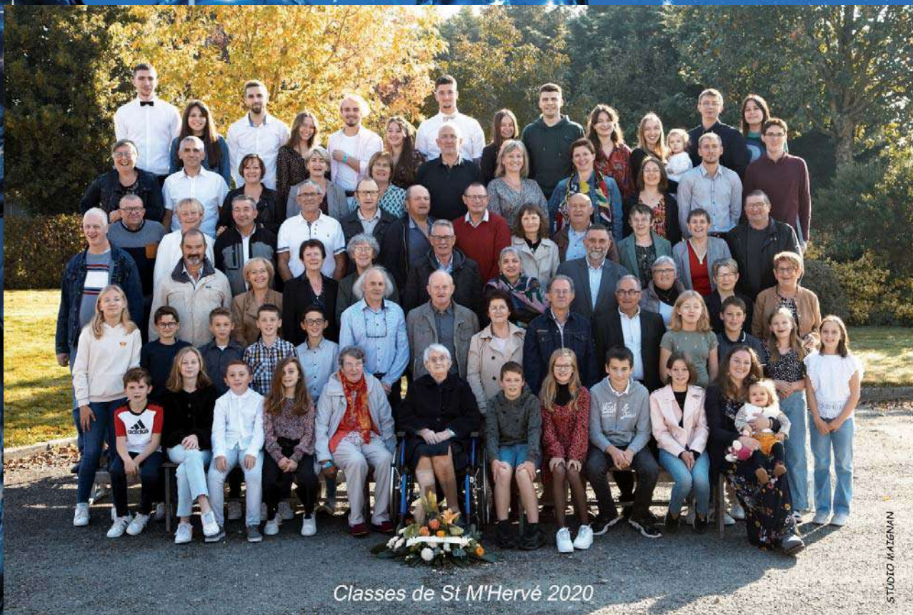
Classes de St M'Hervé 2020