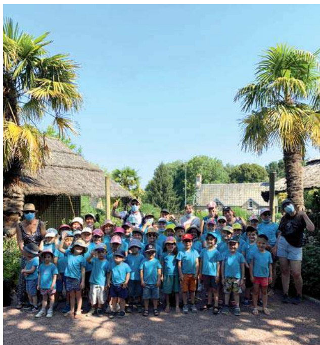
Une quarantaine d'enfants de l'accueil de loisirs de Saint-M'Hervé sont partis au zoo de Champrépus.