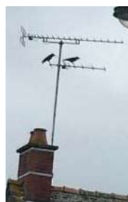
Choucas des tours