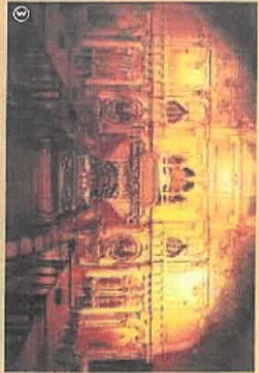
Café des Orgues

Des maisons de brique rouge aux toits vernissés (pauvres lanternés) et aux volets de bois peints en bleu, vert ou jaune... Herzele respire tout l'esprit de la Flandre. Cette familiarité de ses toits, l'air, le village possède une hauteur (église-halle) qui abrite deux recitels (celui du maître auet celui de la vierge). Mais le cœur d'une ville morte le café des orgues. C'est dans