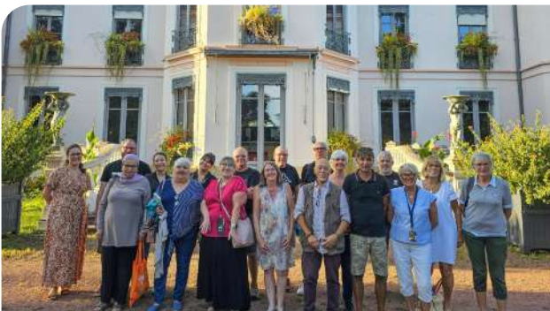
Le succès de la Fêtobourg serait impossible sans ses bénévoles...