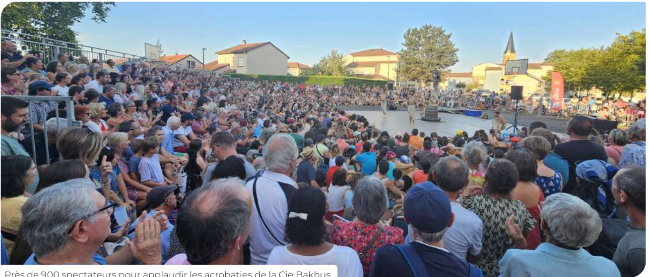
Près de 900 spectateurs pour applaudir les acrobaties de la Cie Bakhus.