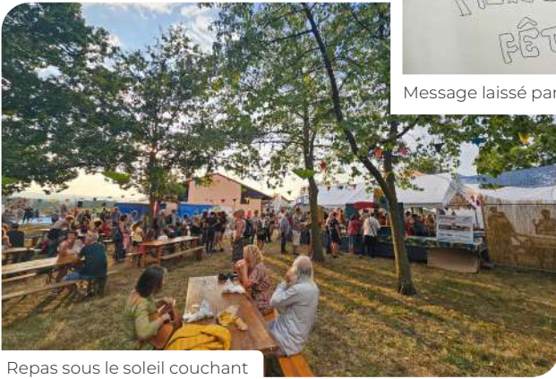
Repas sous le soleil couchant