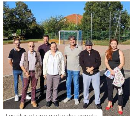
130m 2 de verdure supplémentaire et de nouvelles installations propices à la détente