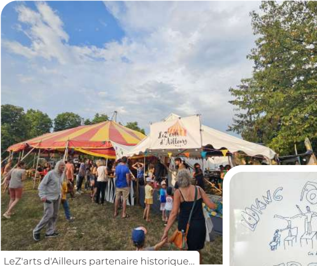
LeZ'arts d'Ailleurs partenaire historique...