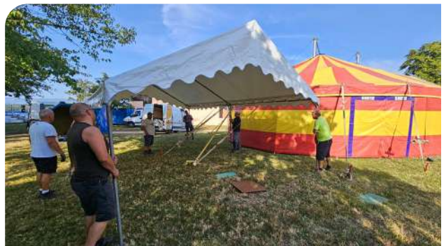
... et les agents des services techniques !