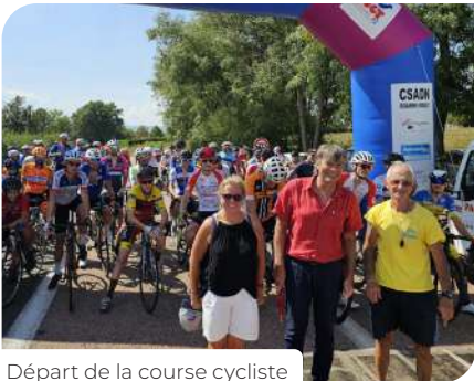
Départ de la course cycliste