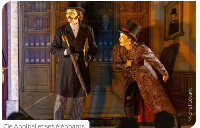
Cie Annibal et ses éléphants