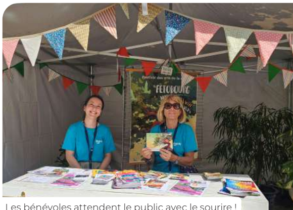
Les bénévoles attendent le public avec le sourire !

Préparé par le service culturel, en partenariat avec l'association LeZ'arts d'Ailleurs, ce festival gratuit des arts de la rue, ancré dans le paysage Mablyrot depuis 1997 (année où le terme de « Fêtobourg » apparaît pour la 1 ère fois) a tenu une nouvelle fois la promesse de rendre la culture accessible à tous.