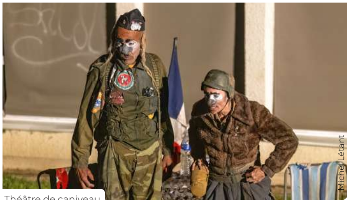
Théâtre de caniveau