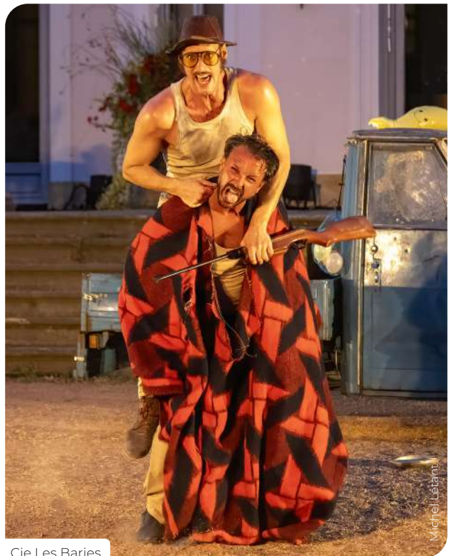
Cie Les Barjes