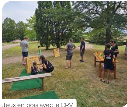
Jeux en bois avec le CRV