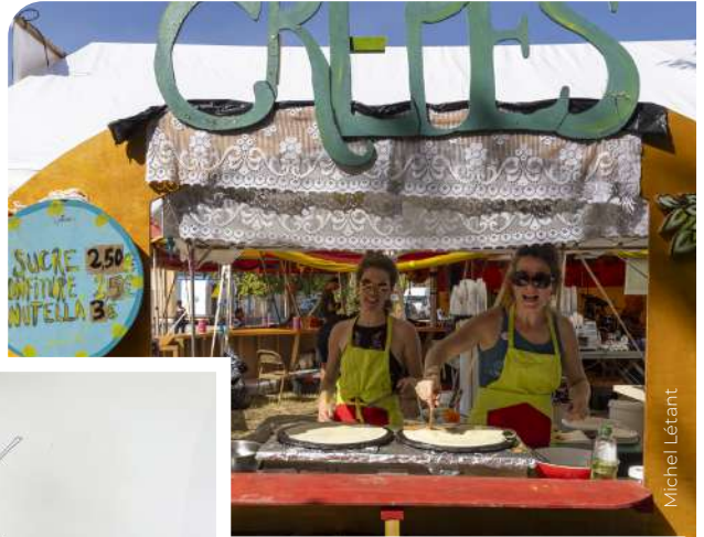
... attendant les festivaliers sous le chapiteau