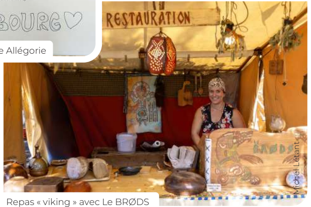
Repas « viking » avec Le BRØDS