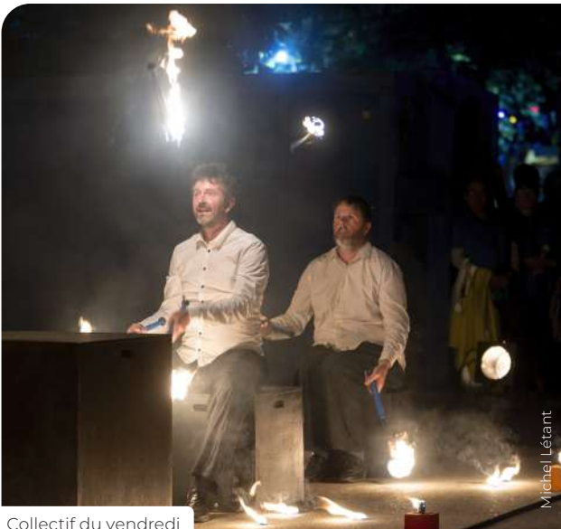
Collectif du vendredi