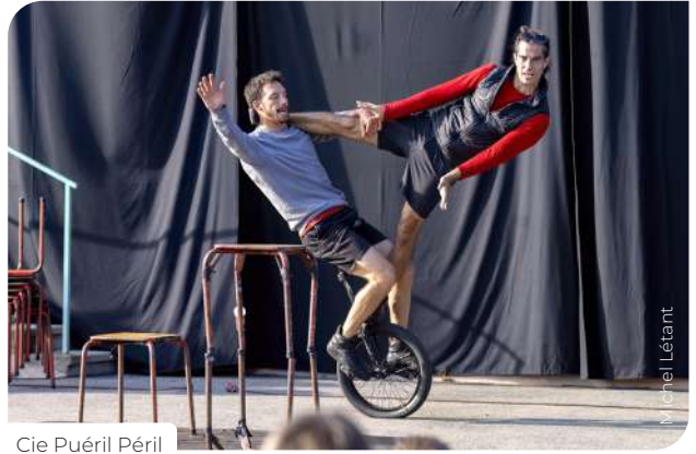
Cie Puéril Péril