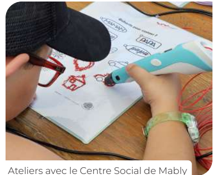
Ateliers avec le Centre Social de Mably