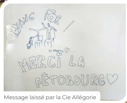
Message laissé par la Cie Allégorie