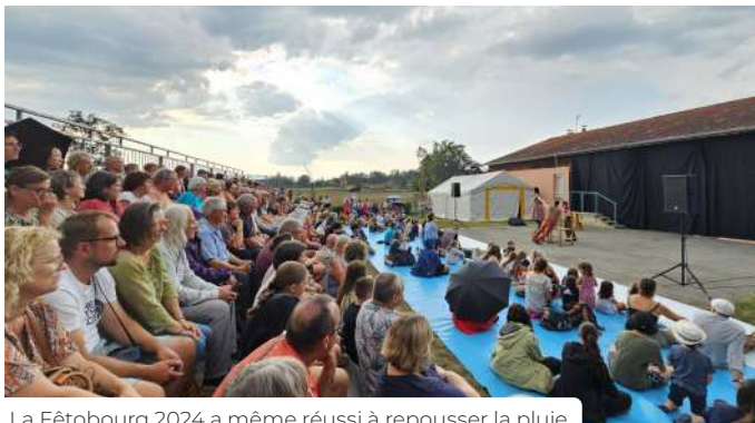
La Fêtobourg 2024 a même réussi à repousser la pluie.