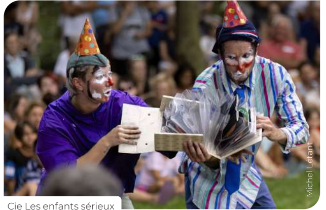
Cie Les enfants sérieux