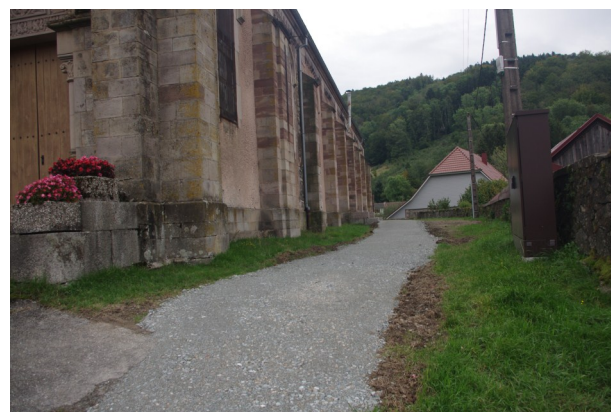
La rampe d'accès menant à la porte côté gauche.