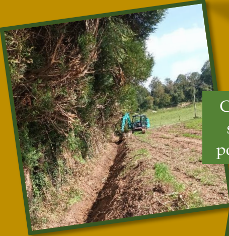
Création d'un fossé au stade route de Bures pour la gestion de l'eau