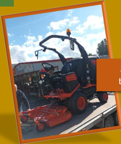
Acquisition d'un tracteur tondeuse