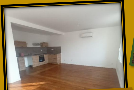
Fin des travaux du logement « rue du Général de Gaulle »