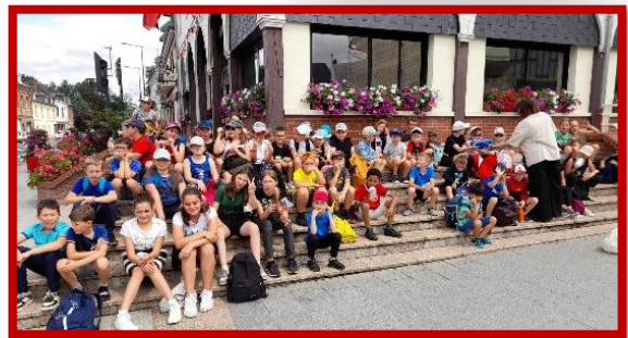
La cérémonie d'ouverture des jeux olympiques à Londinières et à la MARPA