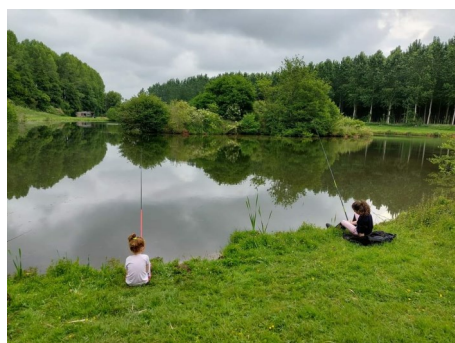
L'ouverture de notre bel étang...