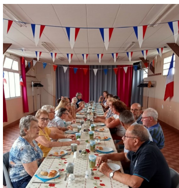
14 juillet ...