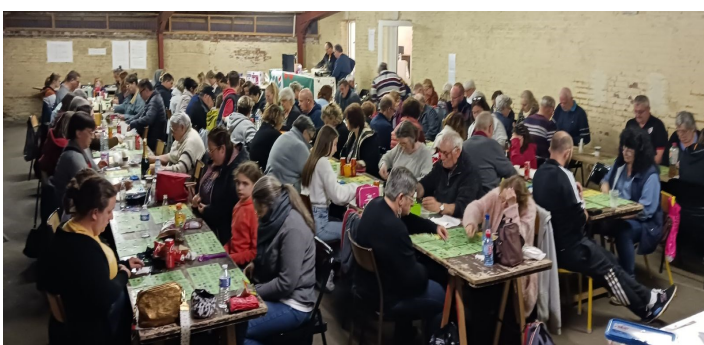
Le loto ...