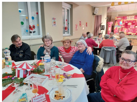
Repas des séniors organisé par le Centre social rural. Il a eu lieu à Domeliers cette année.