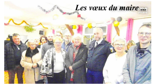
Les vœux du maire