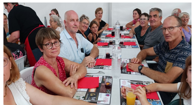
Sortie « Le souffle de la terre »