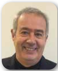
Diogène BATALLA Maire