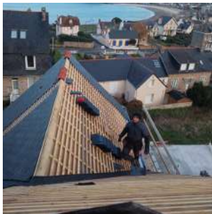
Couverture d'une habitation neuve en ardoises naturelles à Erquy