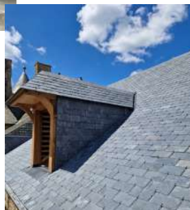
Réhabilitation d'une charpente et couverture avec lucarne Capucine