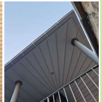
Sous-face à cassette en zinc quartz.