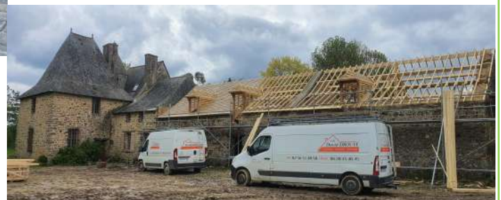
Couverture en ardoises naturelles du Brésil à Montautour

Le zinc, on maîtrise ! Commande exceptionnelle.