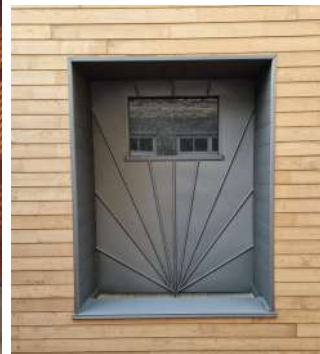
Niche pour pot de fleurs en zinc quartz en cassette avec ourlets gironnés à la galerie d'Art de Chrystèle Ferron (Nasca) à Vitré.