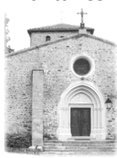
Sts Pierre et Paul