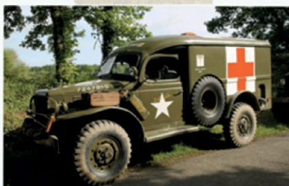
Dodge WC54 Ambulance