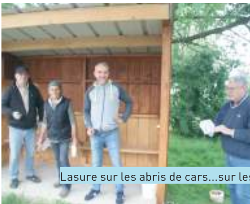
Lasure sur les abris de cars...sur les rambardes des ponts