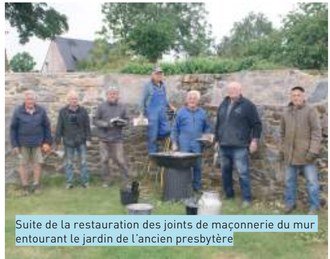
Suite de la restauration des joints de maçonnerie du mur entourant le jardin de l'ancien presbytère