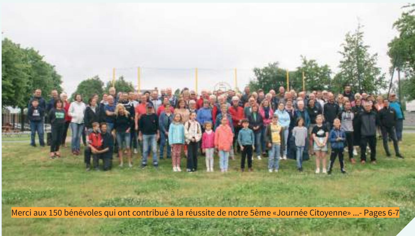
Merci aux 150 bénévoles qui ont contribué à la réussite de notre 5ème « Journée Citoyenne » ...- Pages 6-7