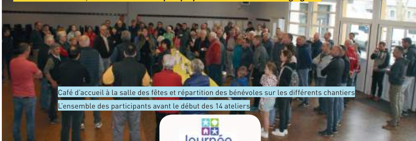
Café d'accueil à la salle des fêtes et répartition des bénévoles sur les différents chantiers

...qui a rassemblé environ 150 personnes (jeunes et moins jeunes) dans la bonne humeur... 14 ateliers proposés ...Comme les précédentes éditions, une journée conviviale, des bénévoles motivés, efficaces et des réalisations qui améliorent notre cadre de vie...Des jeunes du CME se sont ajoutés aux adultes dans certains ateliers...Et nos doyens après avoir partagé le repas du midi se sont rendus sur certains « chantiers » accompagnés de membres du CCAS. Bravo et merci à tous, sans oublier Pascal qui a préparé l'excellent bœuf bourguignon.