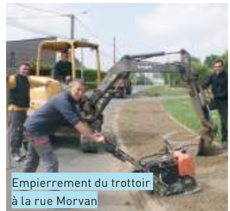
Empierrement du trottoir à la rue Morvan