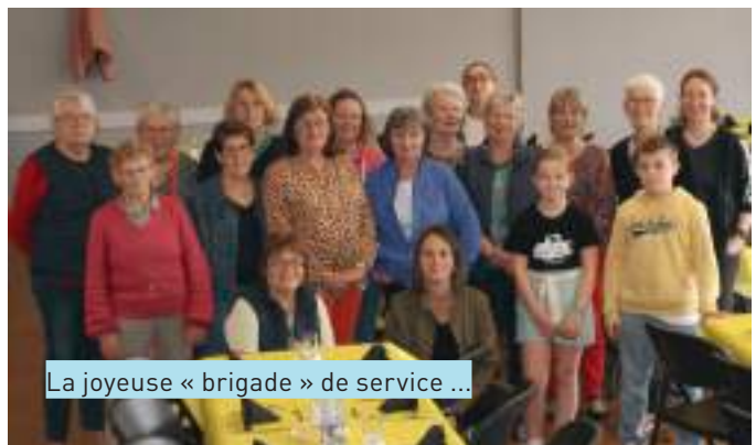
La joyeuse « brigade » de service ...