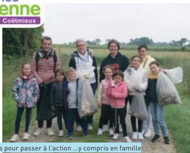
Ramassage des débris sur la commune..Prêts pour passer à l'action ...y compris en famille