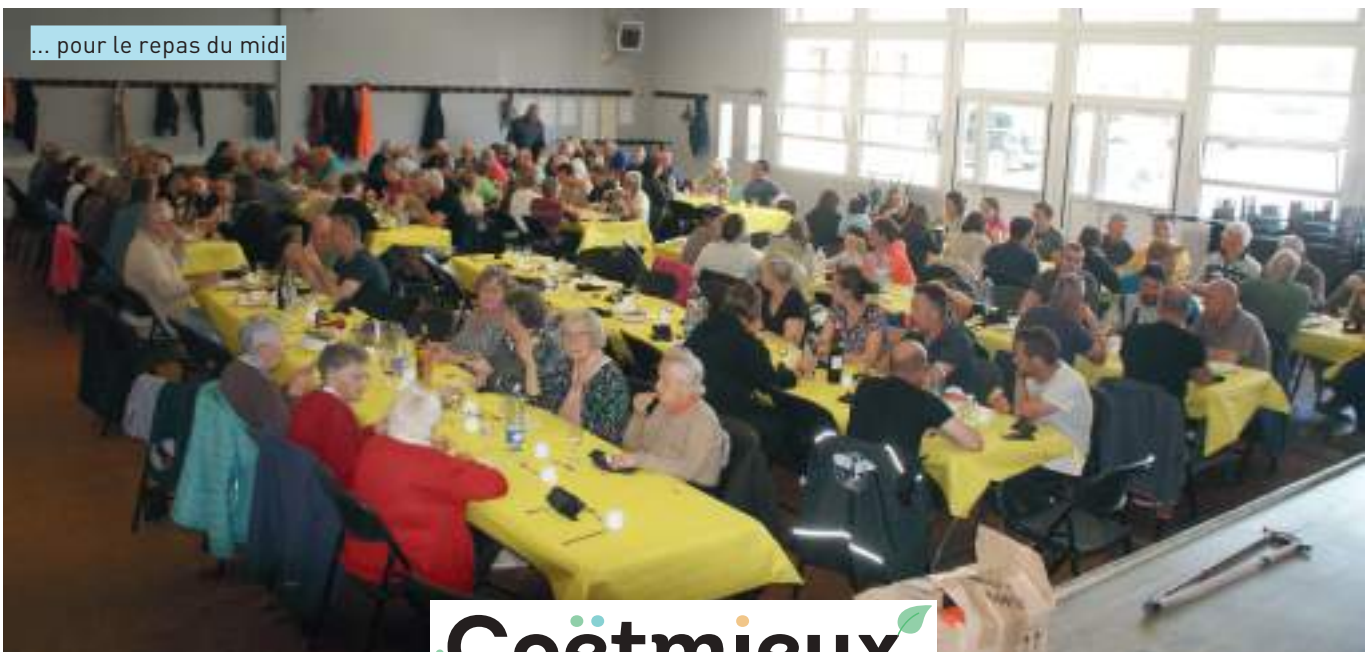
... pour le repas du midi