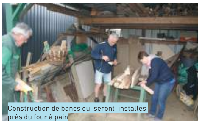
Construction de bancs qui seront installés près du four à pain