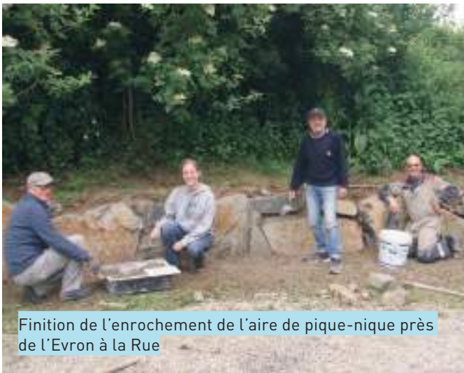
Finition de l'enrochement de l'aire de pique-nique près de l'Evron à la Rue