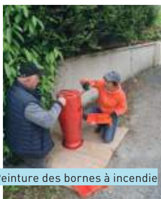
Peinture des bornes à incendie