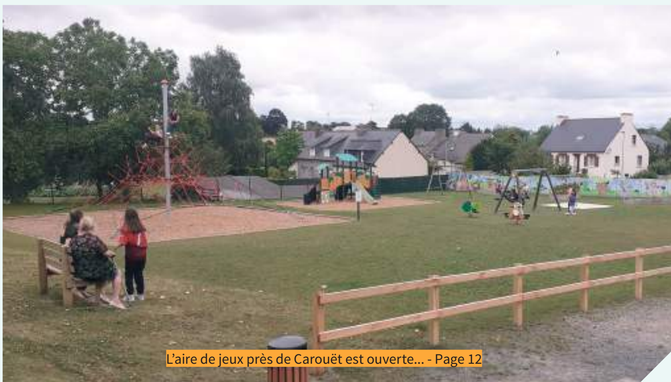
L'aire de jeux près de Carouët est ouverte... - Page 12