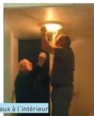
Lasure sur la structure en bois des jeux de boules, remise en état et divers travaux à l'intérieur