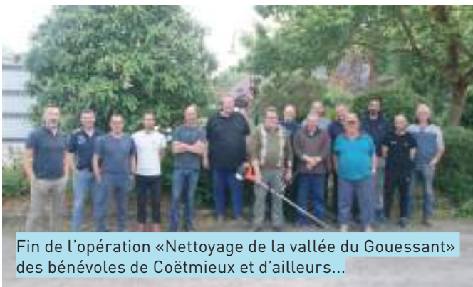
Fin de l'opération «Nettoyage de la vallée du Gouessant» des bénévoles de Coëtmieux et d'ailleurs...