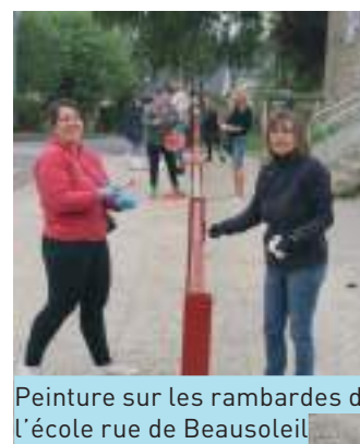
Peinture sur les rambardes devant l'école rue de Beausoleil