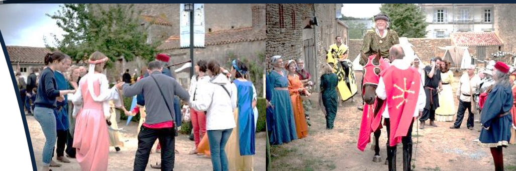
Retour sur les nocturnes médiévales

ÉTANG, RUISSEAU, MARE ... VOUS AVEZ UNE QUESTION SUR LA RESSOURCE EN EAU ?