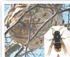
Frelon Asiatique et son nid perché dans les arbres