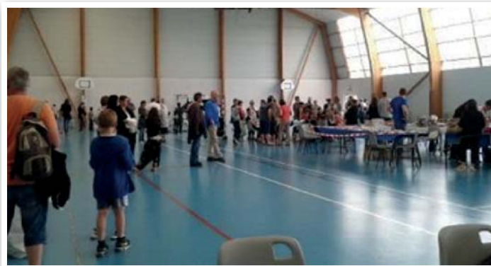
Kermesse du 11 juin