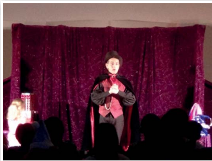
Spectacle de magie

D'ores et déjà, l'association remercie toutes celles et ceux qui apportent leur soutien à ce projet, considérant l'épanouissement des enfants comme un objectif essentiel.