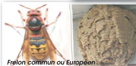
Frelon commun ou Européen