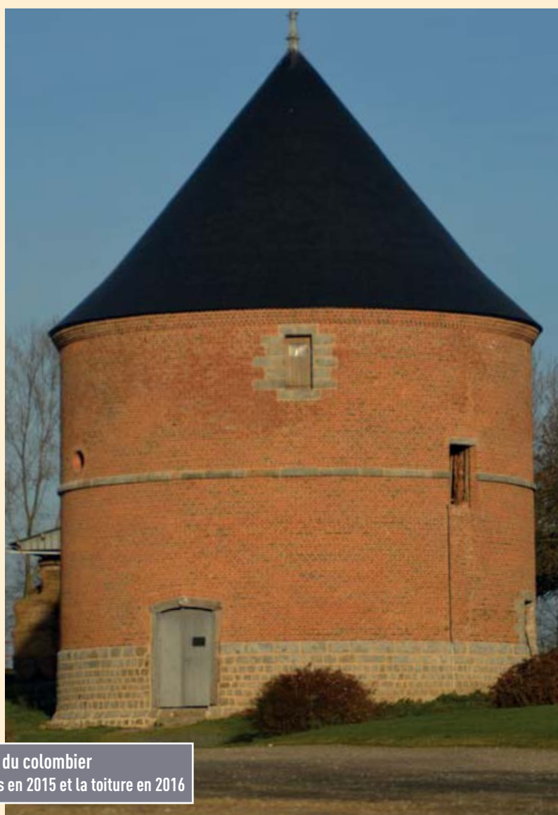
Restauration du colombier La partie mur, les jointements en 2015 et la toiture en 2016

Colombier du XVIIème Siècle, à la ferme du château, le colombier de Neville servait de magasin, de cellier et de logement des fermiers.