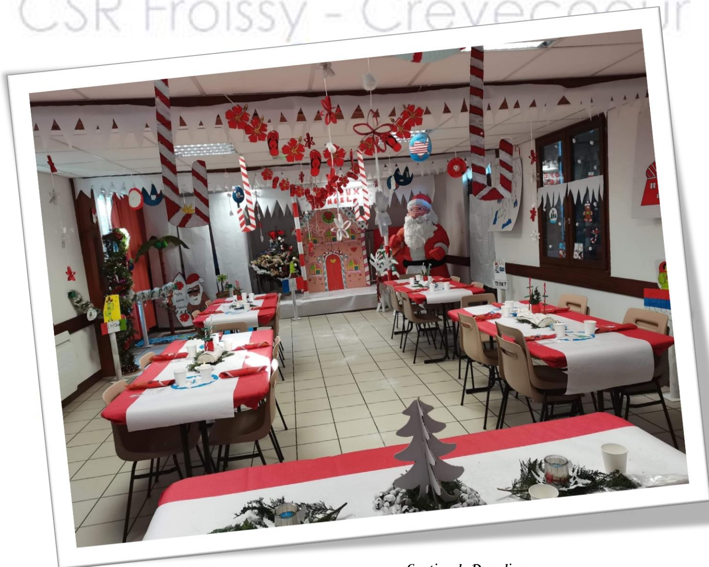
Cantine de Domeliers