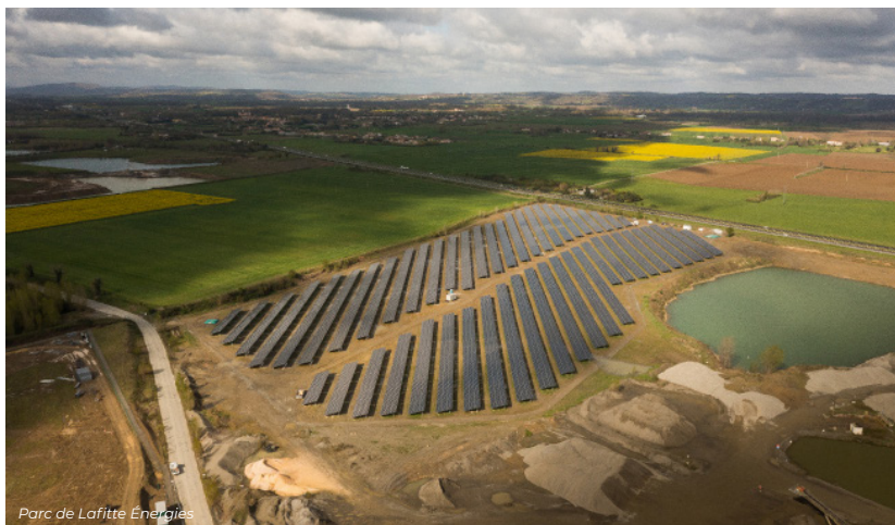
Parc de Lafitte Énergies