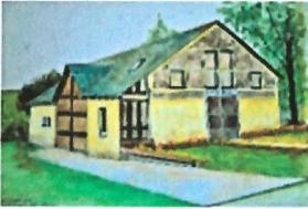
Mairie de Plainval