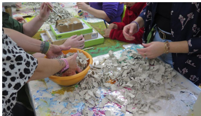
Confection des décors au FAM de Pomponne