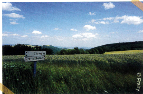
Paysage près du Mont Arjoux