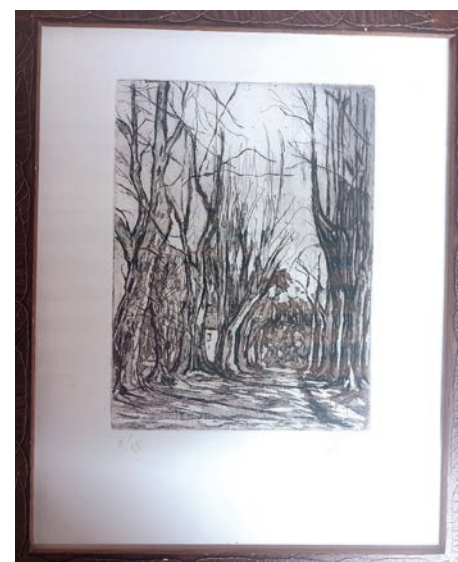
Œuvre signée CANTA , don de la famille CANTAGREL (vue représentant l'allée cavalière du château de Salins).