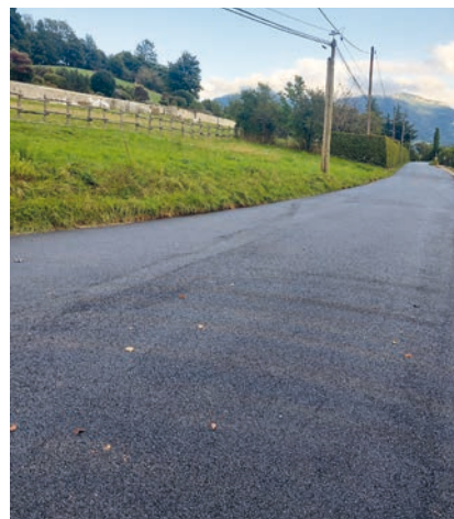
Travaux d'enrobés réalisés sur la route de Lovettaz en septembre 2024.