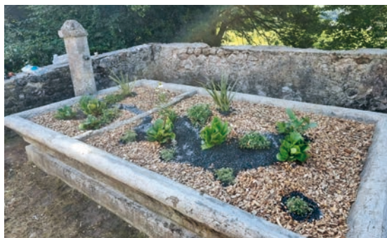
Lavoir route du col des prés: après et avant

Cet été, un chantier écocitoyen a eu lieu sur Saint-Jean-d'Arvey, pendant une semaine afin de travailler pour valoriser les espaces naturels de la commune. Pendant la semaine, une demi-journée est consacrée à un atelier de sensibilisation-action aux enjeux climatiques et de protection de notre environnement!