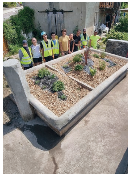
Lavoir route des Bauges: après et avant