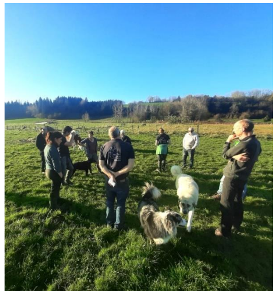
Echanges avec la délégation du PNR de l'Aubrac