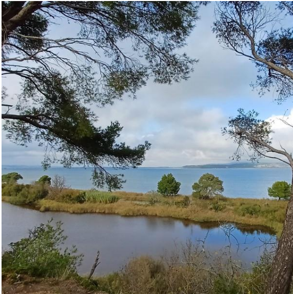
Ile de Sainte-Lucie

débats ont mis en lumière l'importance de la collaboration pour