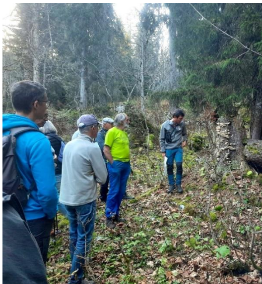
Formation avec les propriétaires forestiers