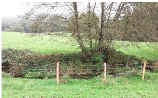
Installation de clôtures, La Conche

L'objectif des travaux de mise en défens est alors de pallier ces atteintes à la qualité de l'eau et des milieux aquatiques en proposant aux riverains des aménagements fonctionnels et durables, adaptés à leurs besoins.