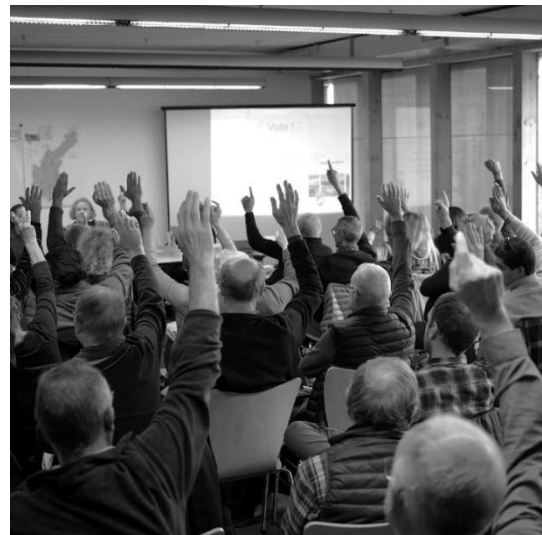
Vote à l'unanimité, Comité Syndical, Lajoux

Voté à l'unanimité, le projet de Charte a ensuite été envoyé aux régions Bourgogne Franche-Comté et Auvergne Rhône-Alpes pour validation.