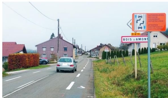
Chaucidou, Bois d'Amont

Les véhicules motorisés circulent sur la voie centrale bidirectionnelle et les cyclistes sur les bandes latérales. En cas de croisement, les véhicules motorisés se déportent ponctuellement sur les bandes latérales mais en cédant la priorité aux cyclistes.