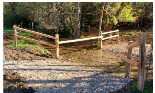
Aménagement d'un passage à gué, Chartru