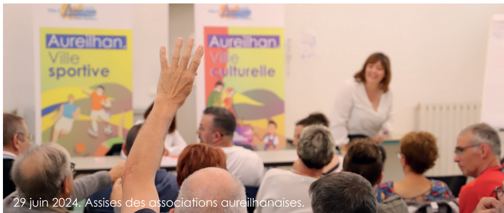
29 juin 2024. Assises des associations aureilhanaises.

Pour feuilleter le guide des associations en ligne, scannez le QR code