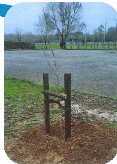
Terrain de pétanque, plantation de 2 peupliers.

Le service espaces verts a planté des arbres dans un mélange terre-compost. Ce compost est produit par les agents techniques à partir des déchets verts collectés sur la commune (déchets de tonte, feuilles mortes ramassées à l'automne, ...). Une partie des arbres plantés sont des sujets de petite taille. Ce choix est volontaire car il est prouvé que la reprise de végétation est meilleure avec de très jeunes arbres : la plante développe un meilleur système racinaire, donc une croissance à long terme bien plus vigoureuse. D'autre part, le prix d'achat de ces petits sujets est aussi plus faible.