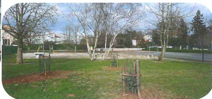
École de la Vallée du Lay, plantation de 2 eucalyptus et 1 érable.