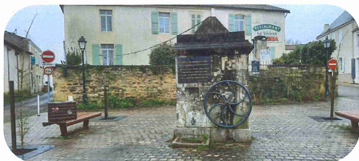
Place Vivier au court, plantation de 4 érables.