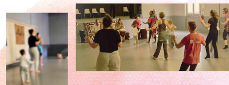
Un bon moment entre parents et enfants le 13 octobre 2024