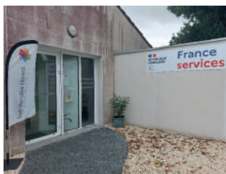
Site de Chaillé les Marais

N'hésitez pas à nous contacter pour connaître tous les services proposés, les animatrices vous réserveront un bon accueil et répondront au mieux à vos attentes.