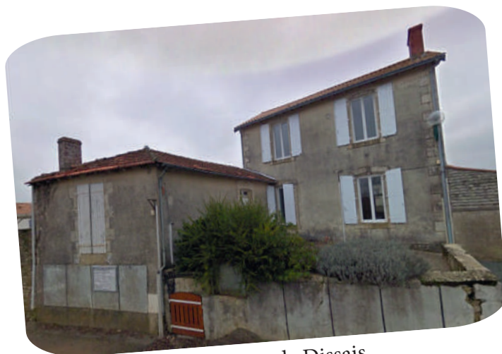
Mairie de Dissais

Enfin la municipalité a pendant longtemps dû louer une salle pour organiser les réunions du conseil municipal. En 1874 la commune de Dissais n'a toujours pas de salle de mairie, elle a donc recours à une location qu'elle renouvelle tous les 2 ou 3 ans et elle peut être expulsée à la fin du bail. Le conseil municipal aimerait construire une nouvelle mairie. En mai 1875, la municipalité éprouve des difficultés à trouver un terrain pour ce projet, elle décide de poursuivre la location d'une salle pour 6 ans avec un loyer de 30 francs par an. En 1890, les réunions du conseil municipal se déroulent dans l'école qui vient d'être construite. Les élus ont pourtant conscience que le bâtiment scolaire n'est pas aménagé pour servir à la fois d'école et de mairie. La mairie possède un terrain entre le chemin et la maison de l'instituteur, elle envisage donc d'y construire la mairie.