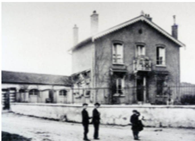
Café place de la gare, siège de la Kommandantur