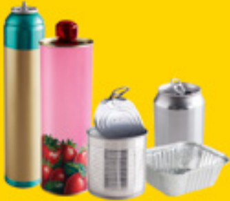
acier / aluminium