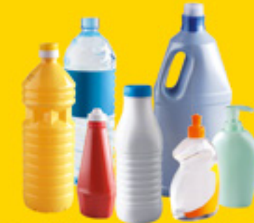
bouteilles / bidons / flacons