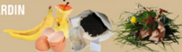
épluchures, coquilles d'œuf, filtres à café, thé, feuilles, fleurs...

Pour acheter un composteur individuel (livraison à domicile) ou + de renseignements, contactez le service Déchets de la CC Loue Lison au 03 81 57 16 70 ou 03 81 63 84 63