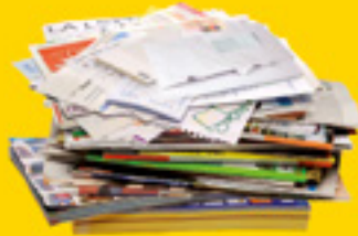
journaux / magazines prospectus / catalogues cahiers / feuilles enveloppes