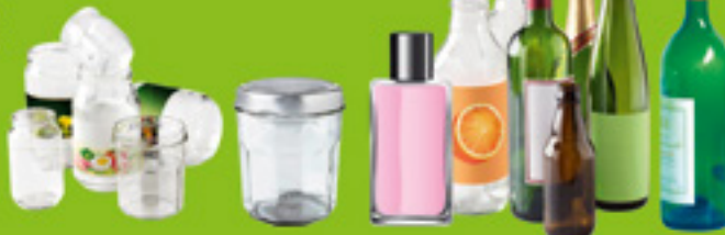
pots / bocaux / flacons / bouteilles