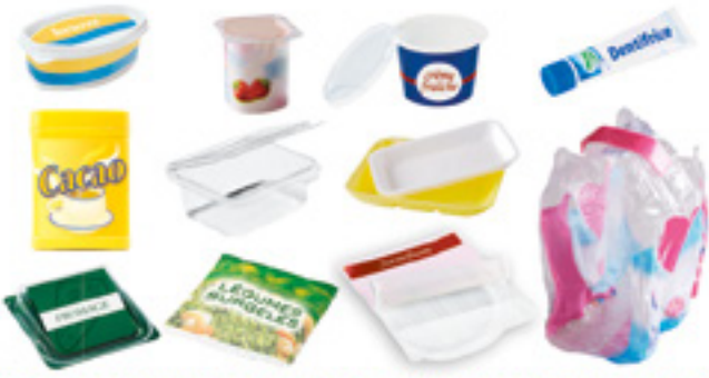
pots / barquettes / boîtes / sachets / films

Merci de séparer les opercules et les films plastiques des pots (yaourts, crème...) et des barquettes (jambon, viande...)