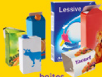
boîtes cartonnettes briques alimentaires

MÉMO-TRI CHEZ VOUS, TOUS LES EMBALLAGES ET TOUS LES PAPIERS SE TRIENT