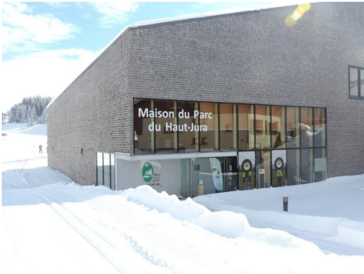
La Maison du Parc sous la neige, à Lajoux

Dans le cadre de l'écriture de la nouvelle Charte du Parc 2026-2041, il a été souhaité que la Maison du Parc soit confortée comme lieu d'accueil, d'échanges et vitrine du territoire. Elle se positionne également en un espace de promotion des produits locaux dont la Marque Valeurs Parc.