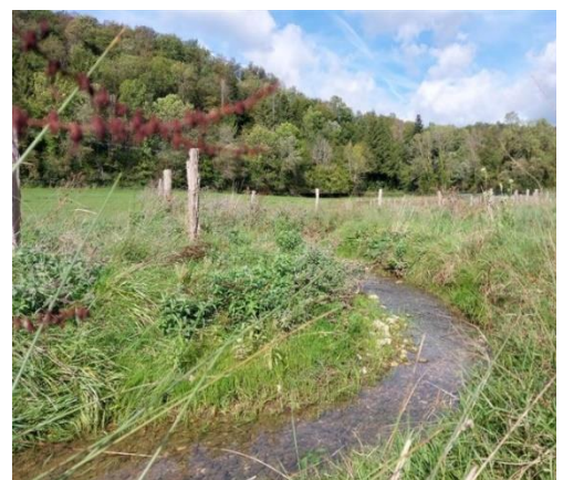
Le lit du ruisseau et ses abords renaturés