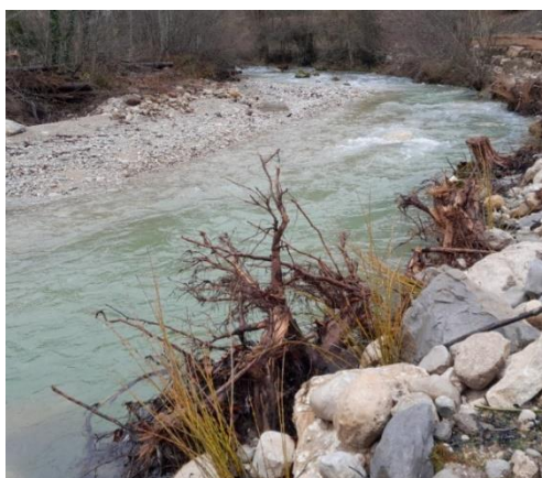
La restauration du Tacon