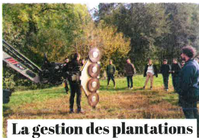
La gestion des plantations

La totalité de votre projet de plantation peut être financé.