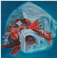
Couleurs baroques et quelques touches de blanc