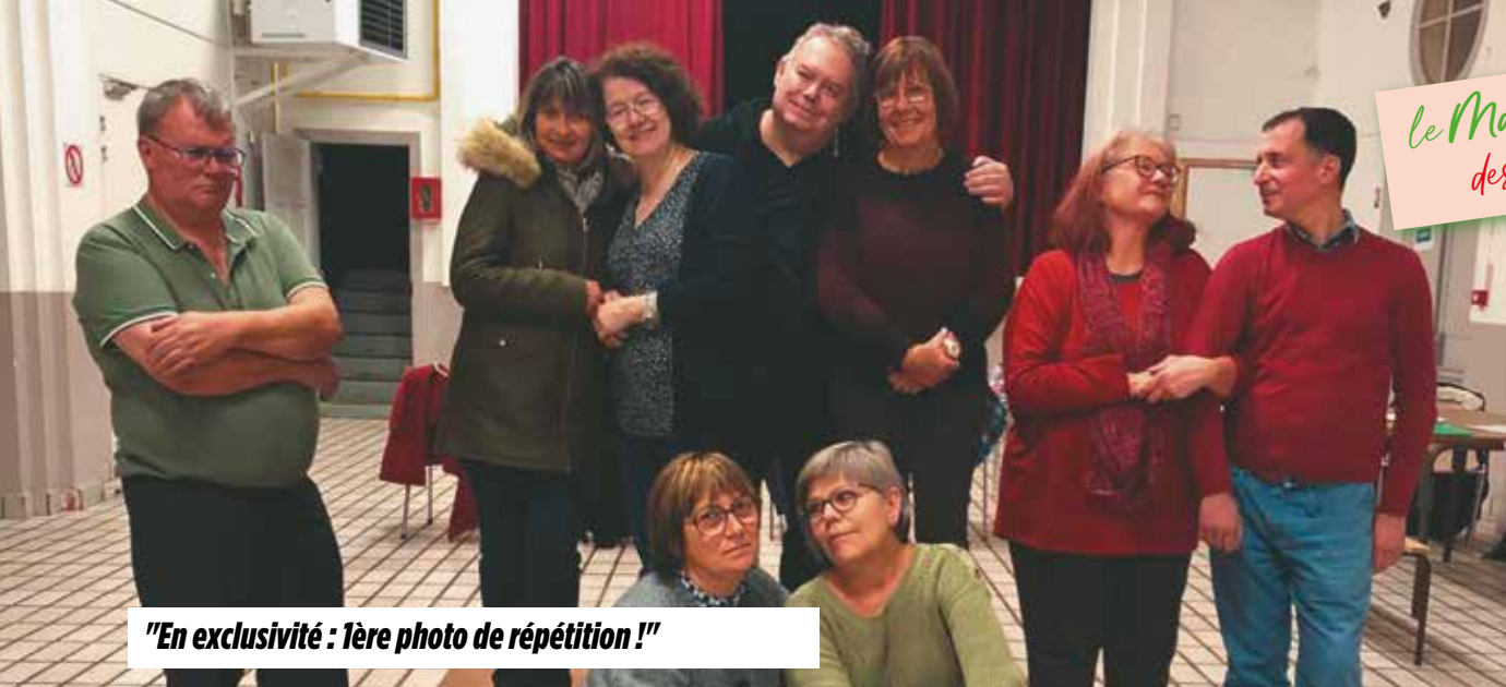
"En exclusivité : 1ère photo de répétition !"