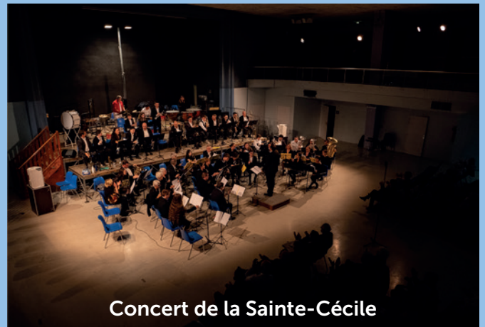
Concert de la Sainte-Cécile