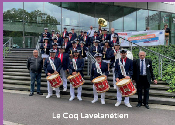
Le Coq Lavelanétien