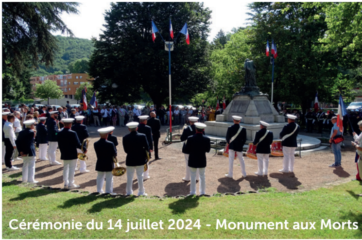
Cérémonie du 14 juillet 2024 - Monument aux Morts

Beaucoup de monde à Lavelanet pour fêter la fête du 14 juillet, fête de la Ville et de la République ; Coq Lavelanétien, Raconte-moi Lavelanet, Porte-drapeaux, Sapeurs-pompiers du Pays d'Olmes, Peloton du 1er RCP, Gendarmerie nationale, Conseil municipal, élus du Pays d'Olmes, Présidents et membres d'associations, Lavelanédiens ont remonté l'avenue du 11 Novembre avant de se rendre au Monument aux Morts où s'était déjà installée l'École de musique municipale et la Société Philharmonique. Suite aux dépôts de gerbes, musiques de circonstance et remerciements aux Porte-drapeaux, le cortège, accompagné des véhicules des centres de secours du Pays d'Olmes a regagné l'Hôtel de Ville pour différents moments d'hommages.