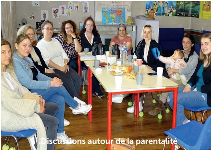
Discussions autour de la parentalité