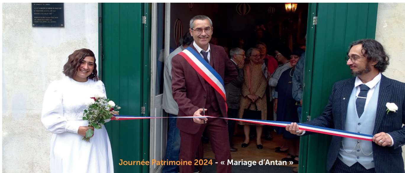
Journée Patrimoine 2024 - « Mariage d'Antan »