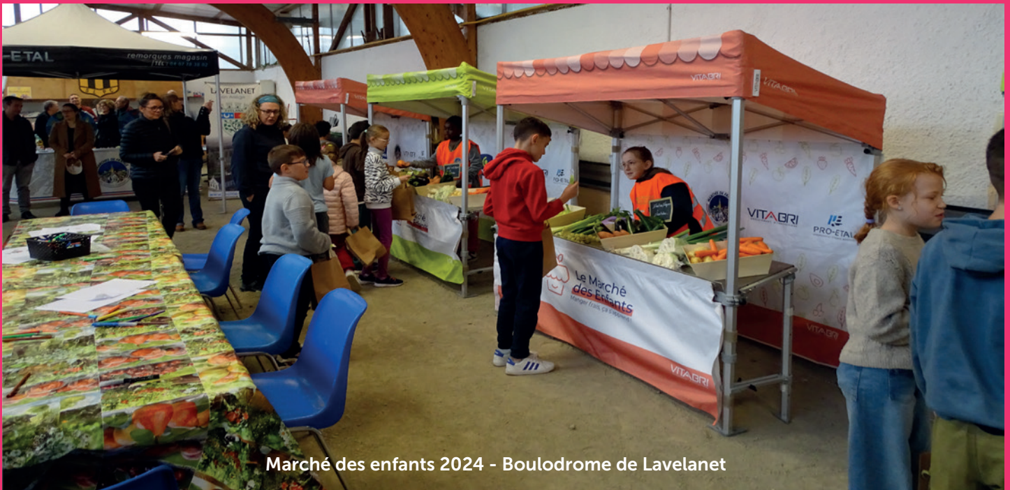
Marché des enfants 2024 - Boulodrome de Lavelanet

Mercredi 3 juillet, une soixantaine d'enfants, fréquentant les centres de loisirs, se sont rassemblés au gymnase Jacquard et sur le stade adjacent pour les Olympiades. Âgés de 3 à 12 ans, ils ont participé à divers ateliers sportifs.