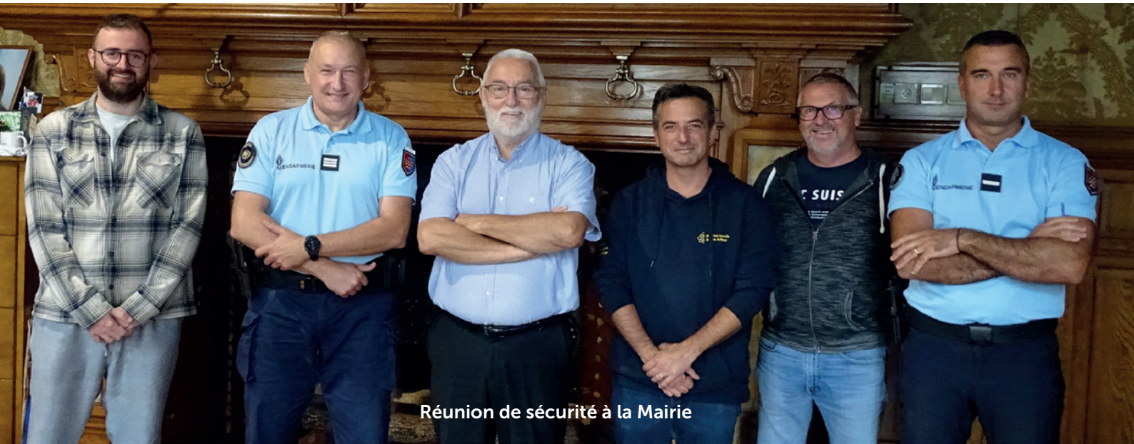
Réunion de sécurité à la Mairie

Tranquillité publique et sécurité. Chaque habitant, chaque habitante, doit se sentir en sécurité dans l'espace public à Lavelanet, à toute heure de la journée et de la nuit. À l'échelle globale, Lavelanet est une ville relativement préservée, bien que des zones de perturbations existent et émergent, de manière sporadique et localisée, nuisant au bien-vivre et à votre tranquillité.