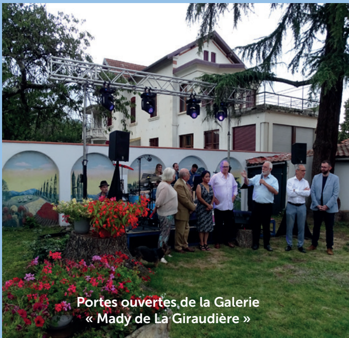
Portes ouvertes de la Galerie « Mady de La Giraudière »