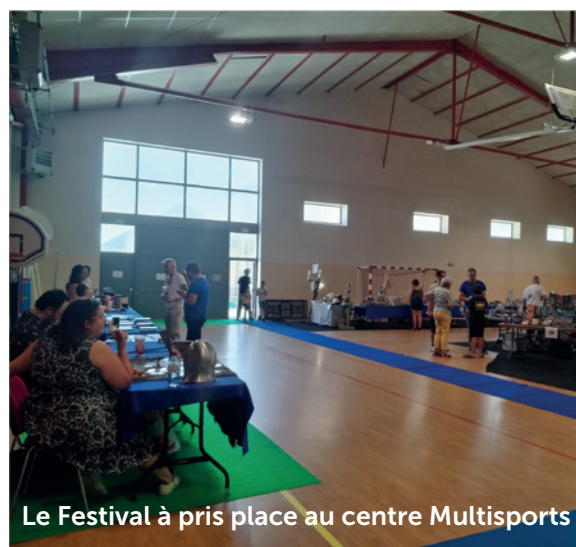
Le Festival à pris place au centre Multisports

Le Festival au Fil des Légendes a tout d'un grand.