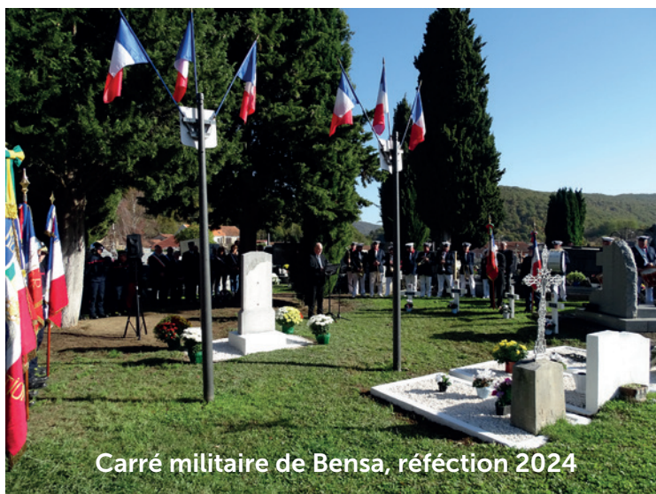
Carré militaire de Bensa, réfection 2024