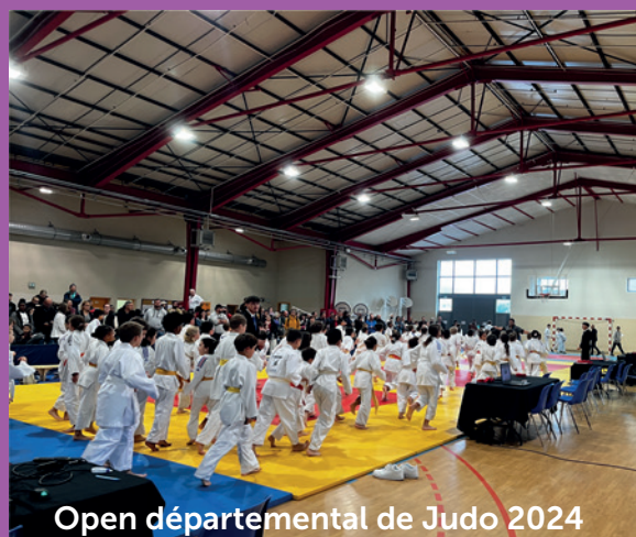
Open départemental de Judo 2024

Samedi 10 novembre, a eu lieu, au centre multisports municipal, le championnat départemental de judo .