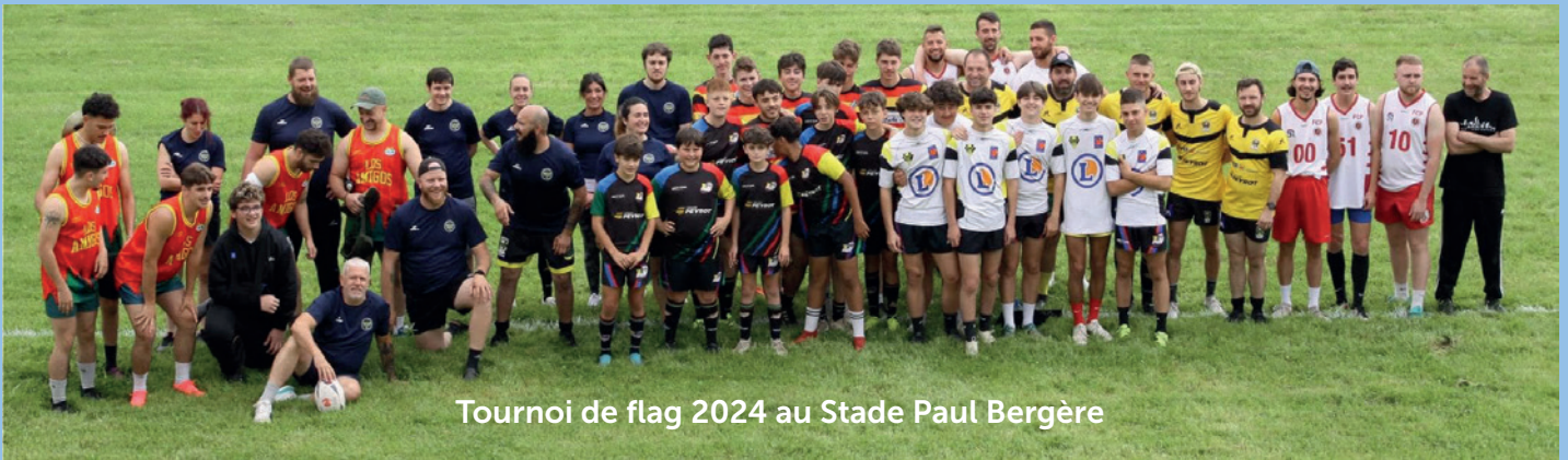
Tournoi de flag 2024 au Stade Paul Bergère