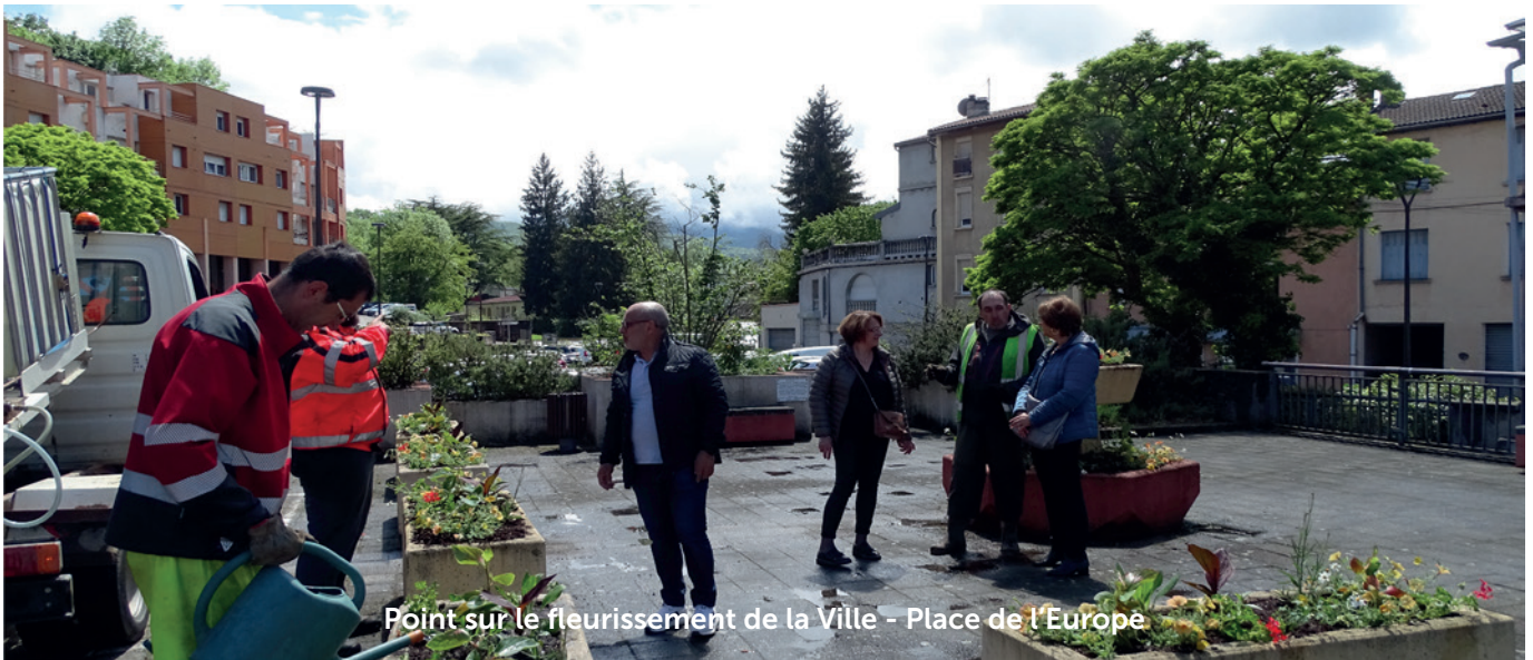
Point sur le fleurissement de la Ville - Place de l'Europe