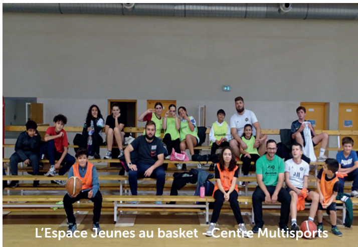
L'Espace Jeunes au basket - Centre Multisports

115 adolescents ont fréquenté l'Espace jeunes l'été dernier. De nombreuses activités variées, qu'elles soient sportives, culturelles ou artistiques, sont proposées, tout au long de l'année aux jeunes. Ces derniers sont pleinement impliqués dans l'élaboration du programme d'activités, ce qui leur permet de participer activement à la création d'un environnement dynamique et engageant. Au cours de cette année, 46 sorties ont été organisées, ainsi que des ateliers, des activités de découverte, offrant ainsi aux jeunes une multitude d'opportunités pour explorer et enrichir leurs expériences.