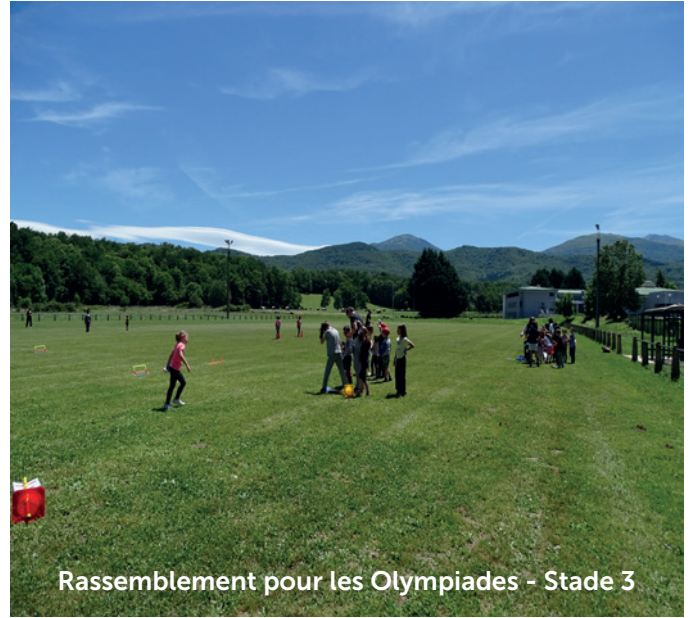
Rassemblement pour les Olympiades - Stade 3

Depuis le début des vacances d'été, les enfants âgés de 3 à 6 ans, et leurs animateurs se retrouvent au centre de loisirs Jean Jaurès. Un lieu adapté à leur âge, avec divers espaces en rez-de-chaussée permettant un fonctionnement plus agréable.