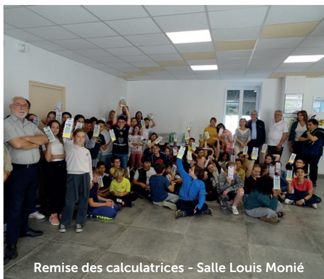
Remise des calculatrices - Salle Louis Monié