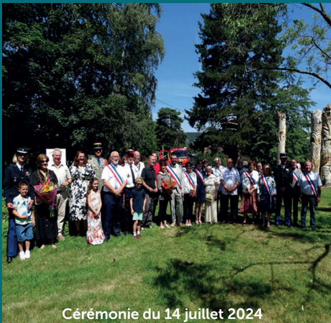
Cérémonie du 14 juillet 2024