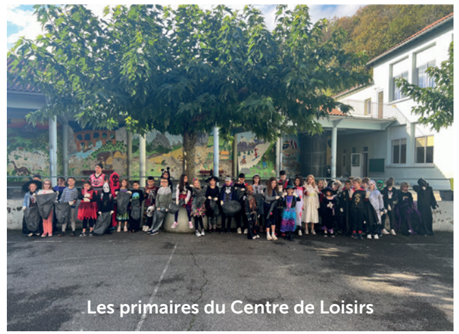
Les primaires du Centre de Loisirs

Tous les quinze jours, le vendredi matin dès 8h30, les parents des enfants fréquentant les écoles publiques maternelles et élémentaires de la ville se retrouvent, salle B, au-dessus de la médiathèque. Un lieu d'échanges, de rencontre, de réflexions, qui permet d'aborder différents sujets sur la vie familiale au quotidien et sur l'éducation des enfants dans le respect des opinions de chacun et en toute convivialité.