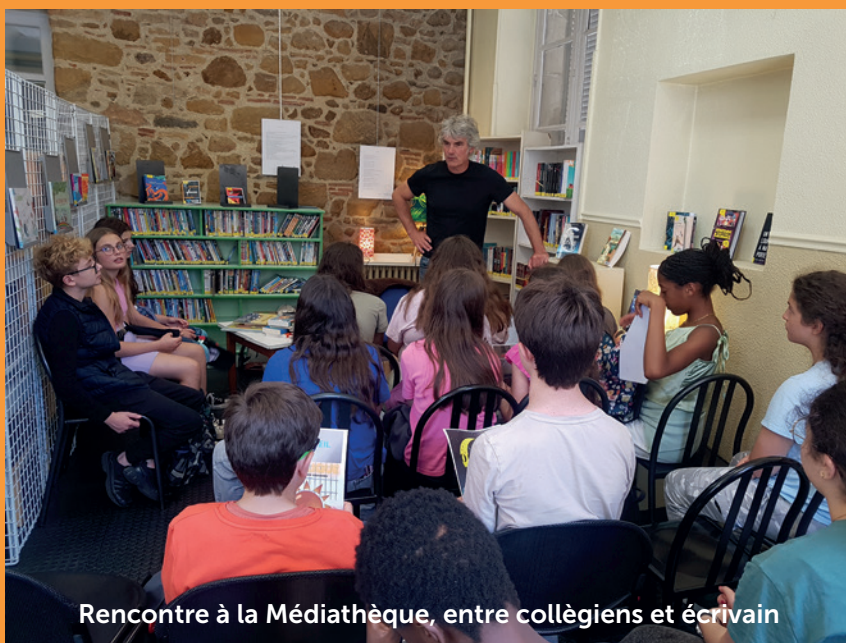
Rencontre à la Médiathèque, entre collégiens et écrivain