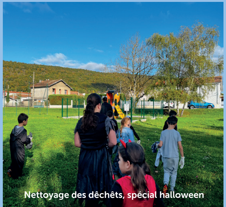
Nettoyage des déchets, spécial halloween