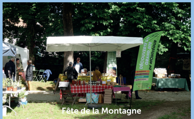
Fête de la Montagne