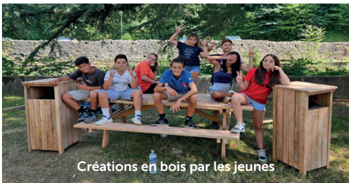
Créations en bois par les jeunes

Les Chantiers jeunes permettent aux volontaires de s'investir dans des actions concrètes pour le bien-être de tous, mais aussi de financer leurs projets de loisirs ou leurs courts séjours.