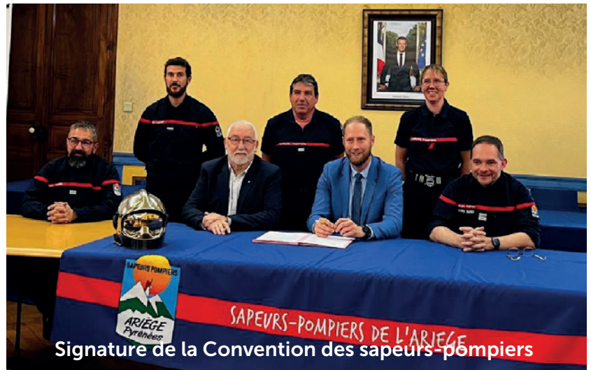
Signature de la Convention des sapeurs-pompiers

Mercredi 22 mai a eu lieu en mairie, la signature de convention avec le SDIS de l'Ariège pour acter la mise à disposition de trois agents pour exercer les fonctions de sapeur-pompier volontaire. Les sapeurs-pompiers volontaires (SPV) constituent un élément clé du maillage territorial. Ils représentent en Ariège plus de 93% des effectifs, d'où l'importance pour notre Ville de les accompagner.