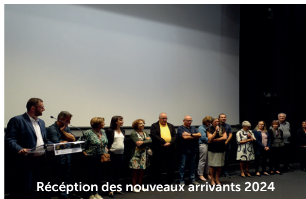
Réception des nouveaux arrivants 2024

Pour la seconde année consécutive, la ville de Lavelanet participe au concours des Villes et Villages fleuris organisé par le Conseil départemental. Ce concours récompense les communes engagées dans une stratégie d'amélioration du cadre de vie. L'an dernier, pour sa première participation, la commune a reçu un prix d'encouragement.