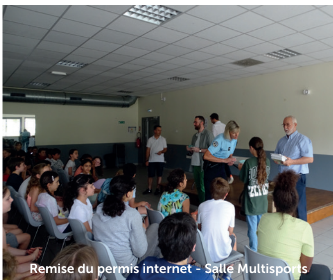
Remise du permis internet - Salle Multisports