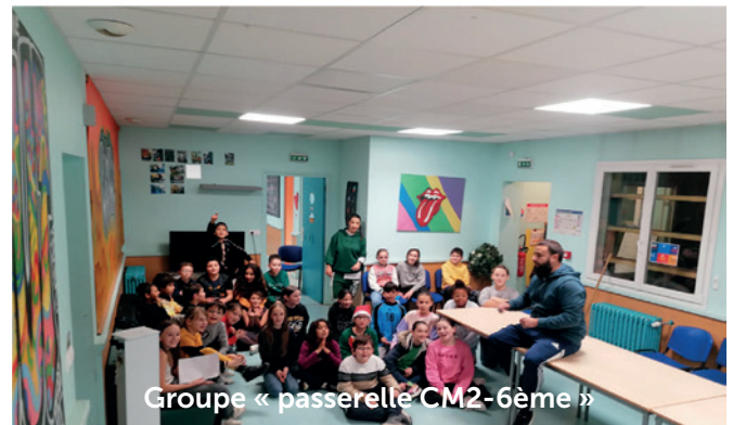
Groupe « passerelle CM2-6ème »

Initiée par Corrado Ranghella, élu délégué à la santé, cette action vise à sensibiliser les enfants à l'importance de l'hygiène bucco-dentaire.