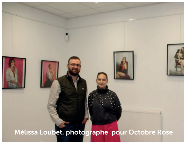
Mélissa Loubet, photographe pour Octobre Rose