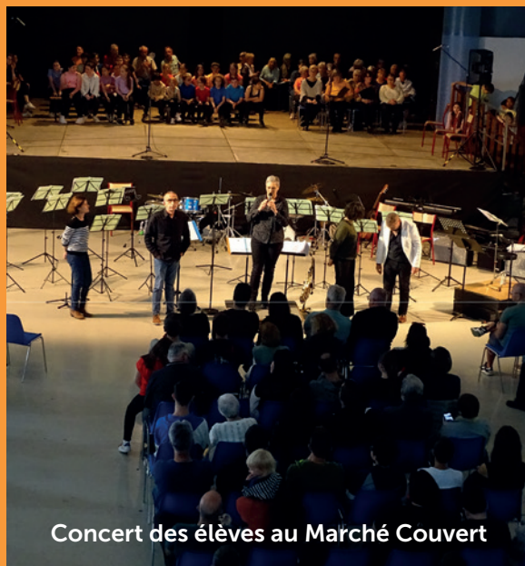
Concert des élèves au Marché Couvert

Le concert « Chansons françaises » des élèves en CM1 et CM2 de l'école Lamartine, des musiciens de l'orchestre junior, de l'atelier « Musiques actuelles », accompagnés pour quelques chants par la chorale « La clé des chants » a fait salle comble vendredi 31 mai au Marché couvert.