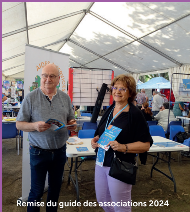
Remise du guide des associations 2024

Beau succès pour le forum des associations qui s'est tenu samedi 7 septembre à la Plaine des sports.