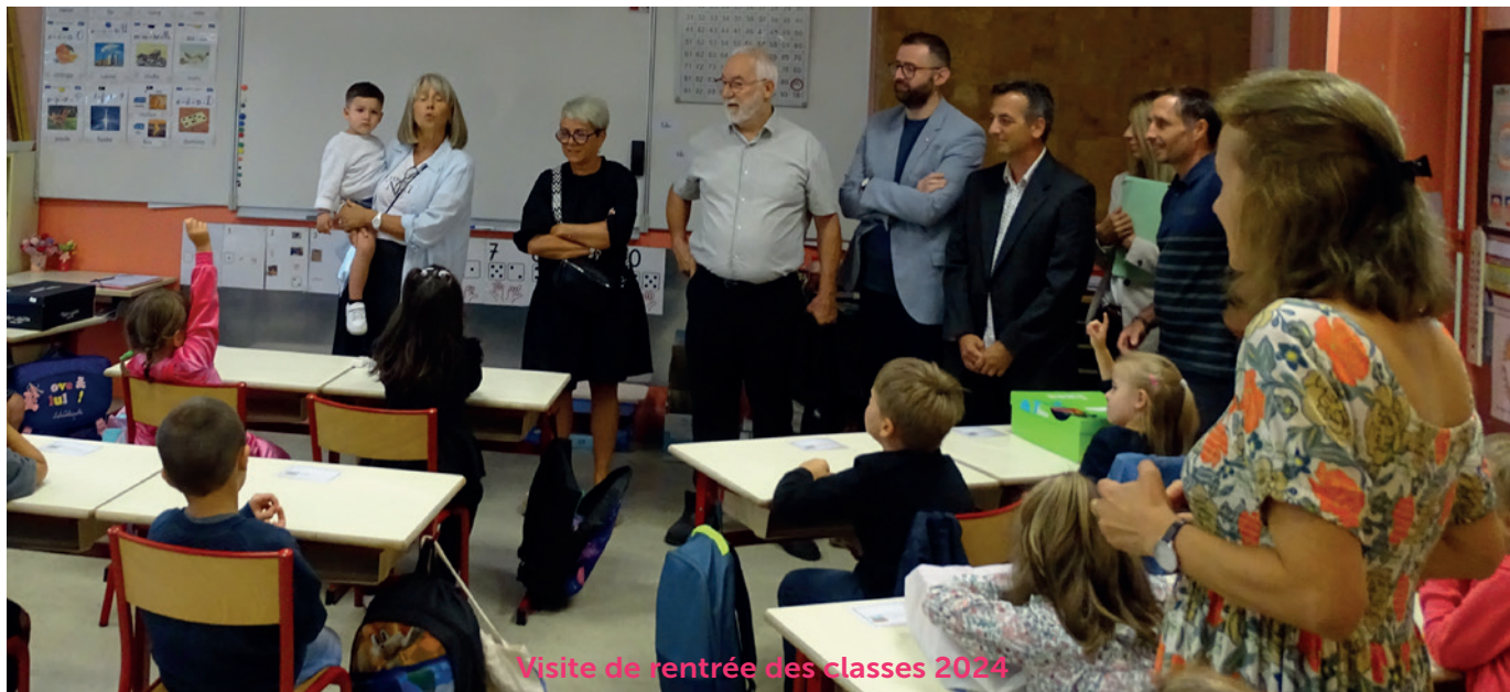
Visite de rentrée des classes 2024