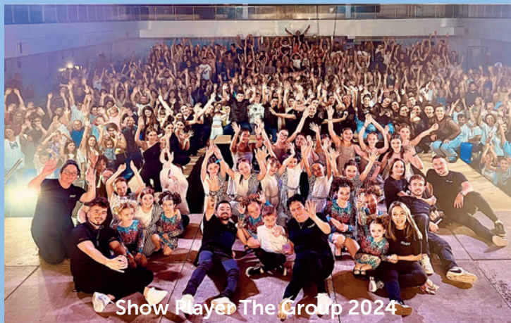
Show Player The Group 2024