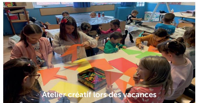
Atelier créatif lors des vacances

Les vacances d'automne auront permis à nos enfants et adolescents de profiter de programmes riches et variés...Merci à nos équipes pour leur engagement envers notre jeunesse.