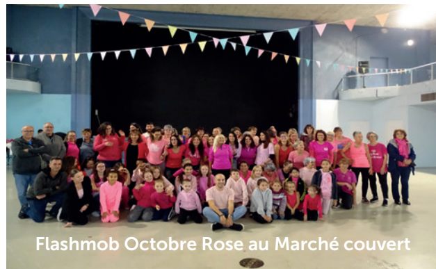
Flashmob Octobre Rose au Marché couvert

La Fête de la Noisette a été belle et a changé de cadre. Nouveauté pour cette 24e édition, l'installation de la fête dans le parc de la mairie (artisans créateurs), le parc de la maison de Roaldès (producteurs et animaux), en passant par l'espace Roudière (bodegas, podium, jeux pour enfants). La Fête de la Noisette a conquis et enchanté le nombreux public... Durant deux jours, Lavelanet a vécu au rythme des savoir-faire et savoir-être. De l'émotion, du plaisir, des partages, des découvertes !