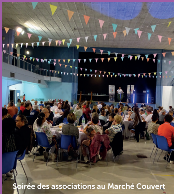
Soirée des associations au Marché Couvert

Toute la journée, la soixantaine d'associations présentes ont alterné entre démonstrations, conseils, et informations en direction des visiteurs. Le soir, environ 230 bénévoles se sont retrouvés au Marché couvert. Une soirée organisée par la municipalité pour les remercier de leur implication, du temps qu'ils donnent aux autres. Les trophées de la vie associative – des bénévoles mis à l'honneur par leur association – les trophées de reconnaissance ou d'honneur venant saluer l'engagement de personnalités ou de clubs ont également été remis par les élus.