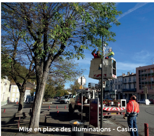
Mise en place des illuminations - Casino