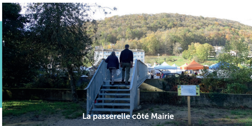
La passerelle côté Mairie

Installée en septembre, une passerelle qui enjambe le Touyre relie désormais l'Hôtel de Ville à l'espace André Roudière. Une initiative municipale saluée par les habitants. Une seconde passerelle sera installée courant 2025 à proximité de la maison de Roaldès et donnera sur le foirail.