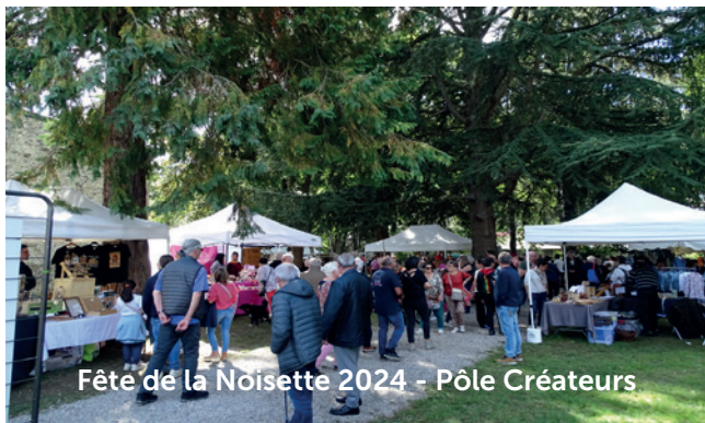
Fête de la Noisette 2024 - Pôle Créateurs

La Fête de la Noisette a été belle et a changé de cadre. Nouveauté pour cette 24e édition, l'installation de la fête dans le parc de la mairie (artisans créateurs), le parc de la maison de Roaldès (producteurs et animaux), en passant par l'espace Roudière (bodegas, podium, jeux pour enfants). La Fête de la Noisette a conquis et enchanté le nombreux public... Durant deux jours, Lavelanet a vécu au rythme des savoir-faire et savoir-être. De l'émotion, du plaisir, des partages, des découvertes !