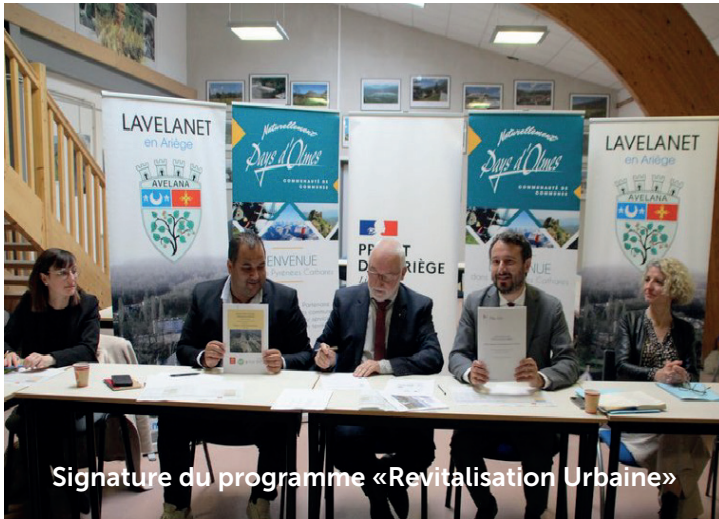
Signature du programme «Revitalisation Urbaine»