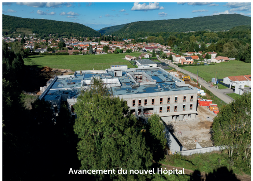
Avancement du nouvel Hôpital

Garder la ville propre, c'est une des missions de la municipalité, mais c'est aussi l'affaire de chacun d'entre nous ! Les services municipaux s'emploient jour après jour à rendre la ville propre et agréable pour tous et notamment pour vous. Cependant, malgré de gros moyens déployés (balayeuse, laveuse, etc.), garder l'espace public propre est un véritable défi : déchets ménagers, encombrants, emballages, cartons, papiers, plastiques, canettes, urines, mégots abîment notre environnement et mettent à mal le travail quotidien des agents municipaux. Des agents rejoints par les techniciens de l'(ESAT) Etablissement et Service d'Aide par le Travail) avec qui la mairie a conventionné. Un peu de civisme, de respect des consignes de collecte et de tri, de petits gestes simples seraient aussi efficaces que des armées de camions et d'agents d'entretien, et tellement moins chers pour la collectivité ! Malheureusement, encore trop souvent, les règles du vivre ensemble sont négligées ! La propreté à Lavelanet est l'affaire de toutes et tous. Mis bout à bout et collectivement, de petits gestes au quotidien peuvent faire la différence !