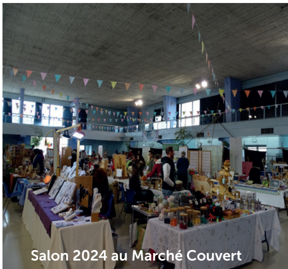
Salon 2024 au Marché Couvert