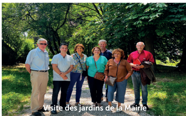
Visite des jardins de la Mairie

Pour la seconde année consécutive, la ville de Lavelanet participe au concours des Villes et Villages fleuris organisé par le Conseil départemental. Ce concours récompense les communes engagées dans une stratégie d'amélioration du cadre de vie. L'an dernier, pour sa première participation, la commune a reçu un prix d'encouragement.