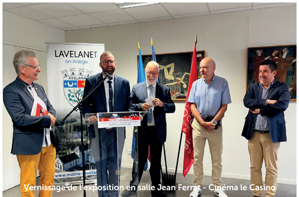
Vernissage de l'exposition en salle Jean Ferrat - Cinéma le Casino