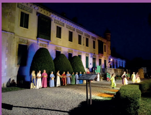
Raconte-Moi Lavelanet 2024

Merci à Raconte-moi Lavelanet pour ces beaux moments de partages.