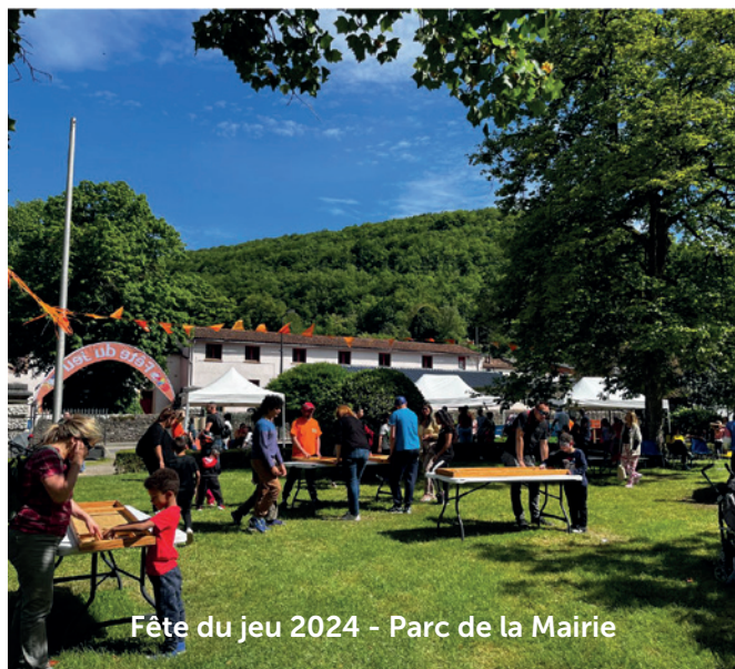
Fête du jeu 2024 - Parc de la Mairie

Pour le 20e anniversaire de la fête du jeu, désormais labellisée manifestation verte, le parc de l'Hôtel de Ville a retenti, samedi 25 mai, de rires, de cris de plaisir, de frissons aussi près de la Tyrolienne, d'exclamations de triomphe dans l'aire consacrée au sport... du bonheur quoi, un bonheur partagé par toutes les générations. Les valeurs véhiculées par la Fête du jeu : gratuité, jeux pour tous, ont permis au public de se rencontrer et partager des moments inoubliables