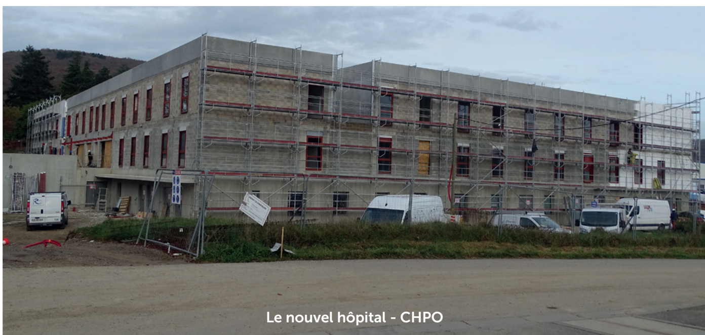
Le nouvel hôpital - CHPO

Depuis plusieurs années maintenant, la municipalité s'est donné pour mission d'entretenir, restaurer et fleurir les 10 sépultures et croix du carré militaire. De la même façon, ces tombes sont fleuries tous les ans, ainsi que celle d'Angelina Vallès, donatrice de la Ville, qui repose au cimetière de Cambières.