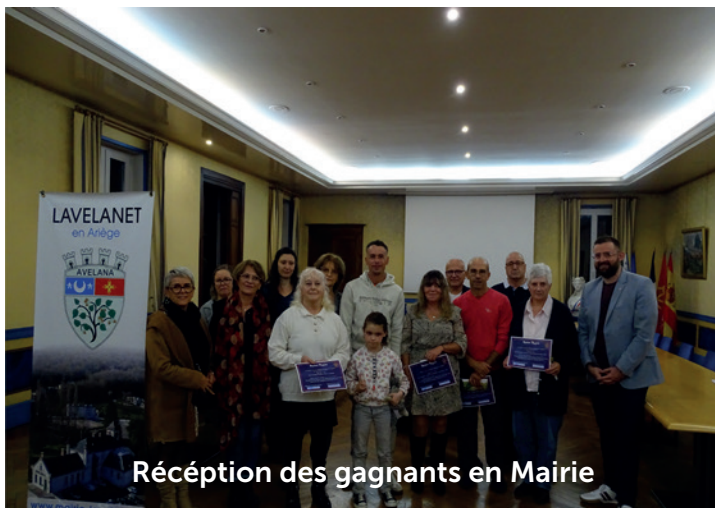
Réception des gagnants en Mairie