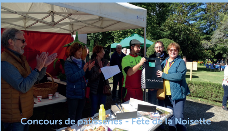
Concours de pâtisseries - Fête de la Noisette