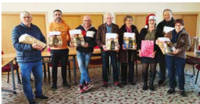
Colis de Noël

Un colis de Noël, offert par la Mairie, sera remis aux personnes âgées de plus de 80 ans non présentes au repas.