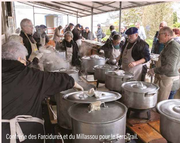
Confrérie des Farcidures et du Millassou pour le Farcitrail.

Véritable fil rouge de la vie de nos villages, la convivialité prend ici tout son sens.