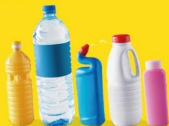
BOUTEILLES ET FLAONS EN PLASTIQUE