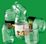
POTS ET BOCAUX EN VERRE