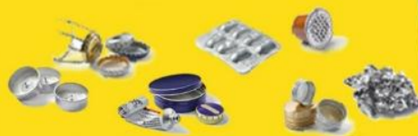
TOUS LES AUTRES EMBALLAGES EN METAL