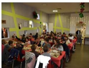
Noël Ecole élémentaire