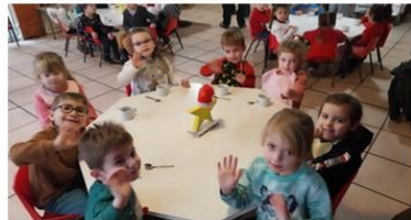
Noël école maternelle