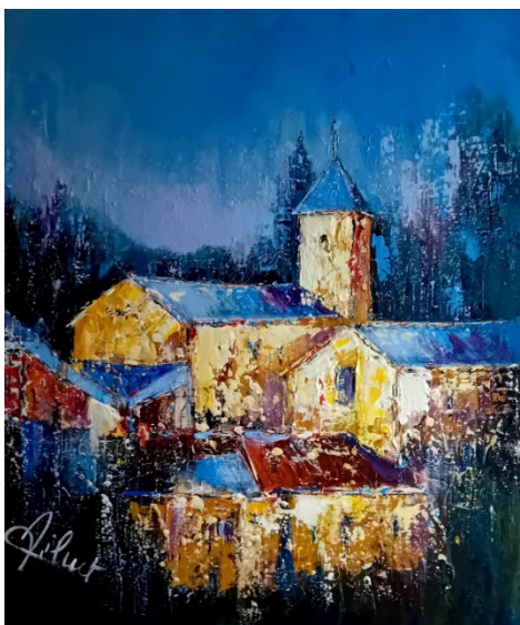
L'église Saint Jean