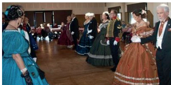
Les membres du Club Perce Neige vous souhaitent une Bonne Année 2025.