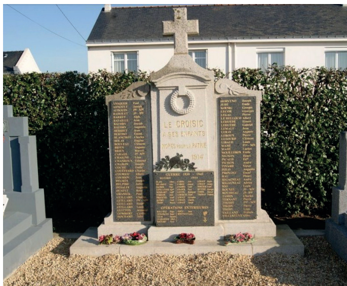
La liste inscrite sur le monument aux morts du cimetière communal