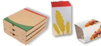
Les boîtes et emballages