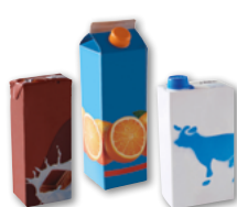
Les briques alimentaires