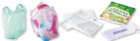
Les sacs, sachets et films plastique