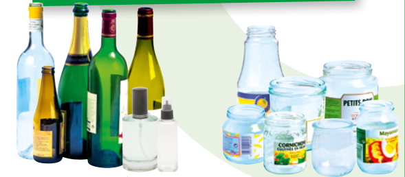
Les bouteilles, les flacons de parfum et leurs recharges