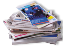
Tous les papiers