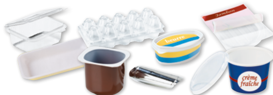
Les pots, boîtes et barquettes