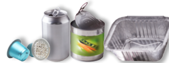
Les boîtes de conserve, canettes et barquettes aluminium