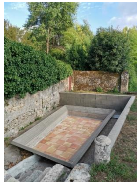
Restauration du Lavoir