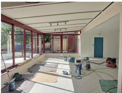
Isolation de la Garderie

Un sage disait « une image vaut 1000 mots », alors, en image nous allons vous présenter une partie des travaux ayant été réalisés sur notre commune ces derniers mois :