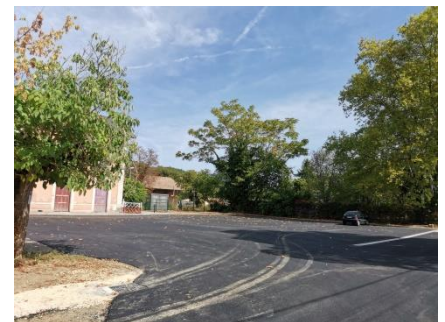
Parking de la gare

D'autres travaux ont été réalisés cet été, travaux routiers par la CDC et éclairage public (passage en LED) afin de modérer notre consommation électrique.