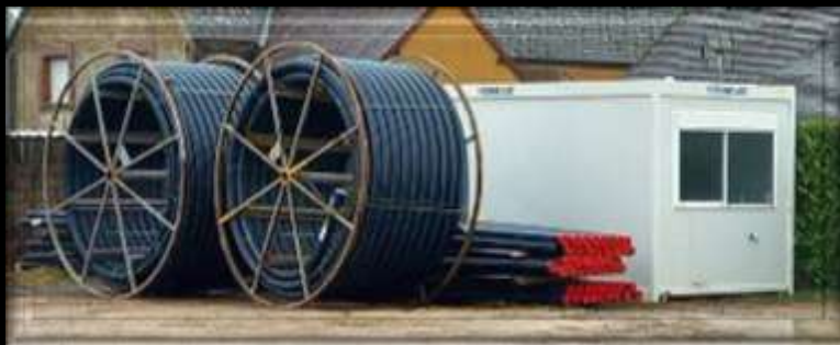
Préparation du chantier