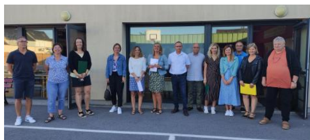
Le corps enseignant de l'école primaire accompagné des élus

Nous souhaitons à tous les élèves et enseignants une année scolaire enrichissante et pleine de succès.