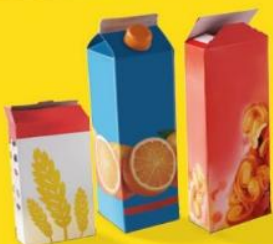
BRIQUES ET EMBALLAGES EN CARTON